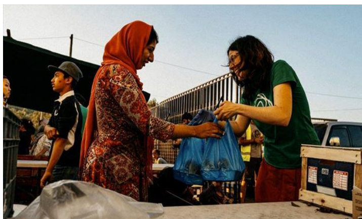
Imagen 12: Reparto de raciones de comidas en el campo de refugiados de Kara Tepe, Lesbos.

En la cocina de Zaporeak en Lesbos se elaboran menús nutritivos y completos, que puedan aportar lo que en muchas ocasiones no reciben de las autoridades responsables. Centrarse en alcanzar el índice necesario para el correcto funcionamiento del organismo humano es fundamental para reforzar su sistema inmunológico, puesto que en los campos las condiciones habitables no son, lógicamente, las más idóneas. Además, los menús se conforman de una mezcla de estilo vasco con toques de recetas de las diferentes culturas que se encuentran en el campamento, tratando de dignificar sus costumbres.