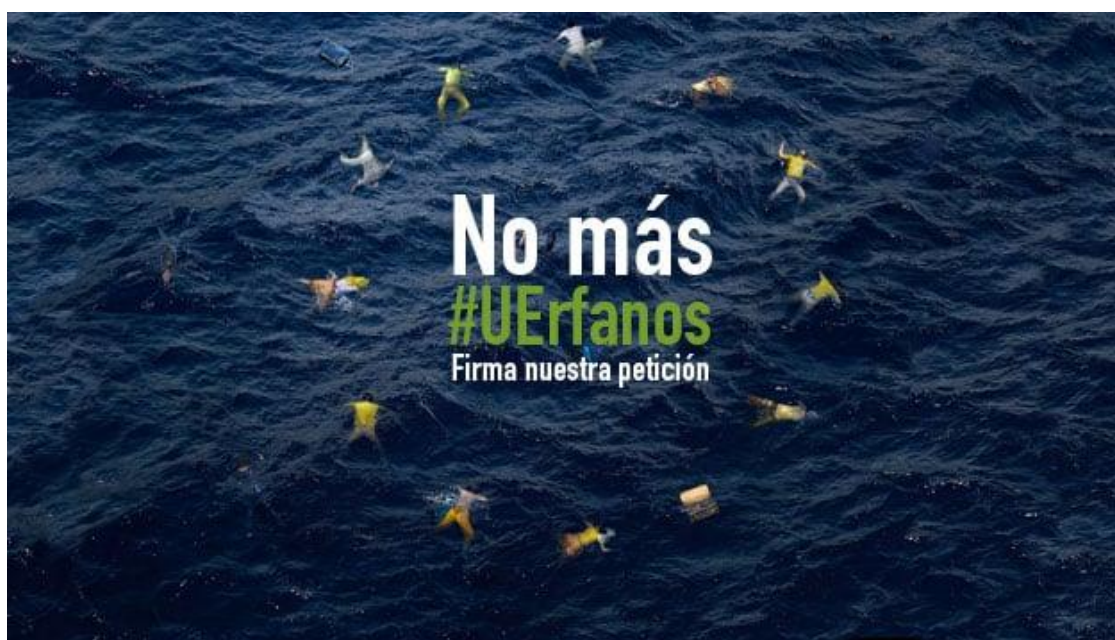
Imagen 24: campaña “No más #UErfanos”.

cooperando con ONG en campañas específicas. Esta acción comunicativa suele ser de carácter informal, lo que no supone que alcance un impacto menor, al contrario. Al tratarse de una acción directa, logra conectar emocionalmente con el espectador de forma más intensa que aquellas tradicionales o institucionales (Moreno, 2022). El relato de un voluntario otorga a las campañas no sólo más autenticidad, sino también más cercanía y credibilidad, por lo general, lo que resulta absolutamente crucial para llegar a audiencias más críticas y conscientes.