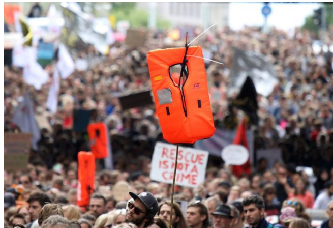
Imagen 15: Activistas manifestándose por los derechos de los refugiados.