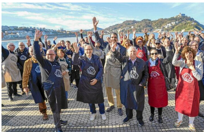
Imagen 13: campaña de Zaporeak junto a voluntarios.

Esta acción fue transmitida esencialmente en el contexto de redes sociales y algunas plataformas de crowdfunding, contando además con el refuerzo de medios locales y el apoyo de cooperativas, comercios y centros educativos de Euskadi. Puesto que su intención era la de crear una relación causa-efecto inmediata, elaboraron un discurso comunicativo basado en lo gráfico, en las imágenes. Está comprobado que un tipo de lenguaje como este, más directo que el verbal, digamos, propicia el impulso de donación (más fácilmente cuando además se incluyen enlaces directos y vías de pago online fiables). El mencionado lenguaje era minimalista e iba al grano, mostraba instantáneas de las raciones de comida, las cifras verídicas de los mensajes que llevaban la atención hacia y motivaban una acción rápida ( Hoy puedes alimentar a alguien y Haz que tu euro cuente ).