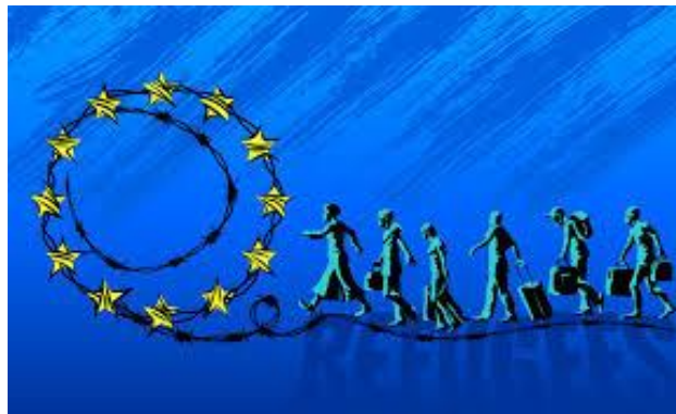
Imagen 5: La instrumentalización de los migrantes y la crisis de los refugiados.