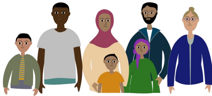
Imagen 1: Ciudadanos del mundo.