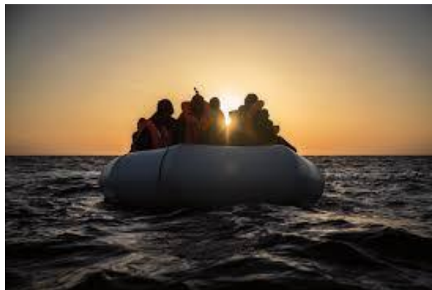
Imagen 3: Rescate en el Mediterráneo.

Organizaciones dedicadas a la protección de los derechos humanos consideran esta disminución como una respuesta a las políticas disuasorias de la UE, teniendo en cuenta asimismo acuerdos con países como Libia y Túnez, donde se han registrado violaciones de los primeros.