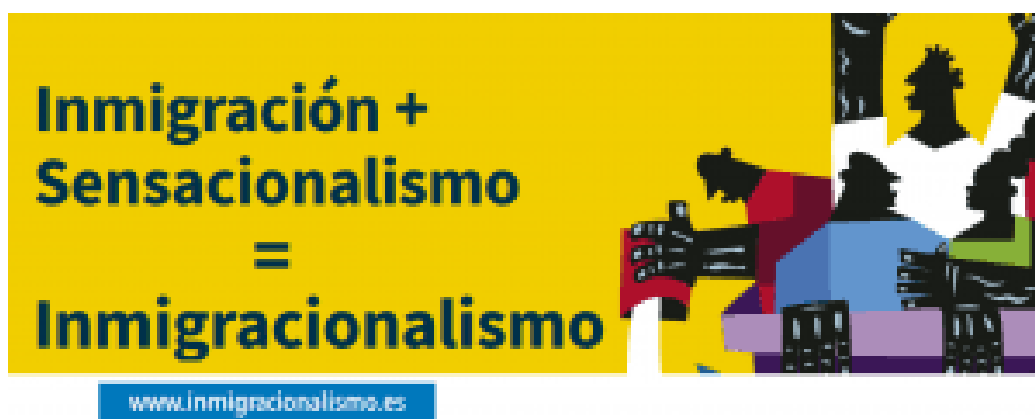
Imagen 8: ¿De dónde viene el inmigracionalismo ?