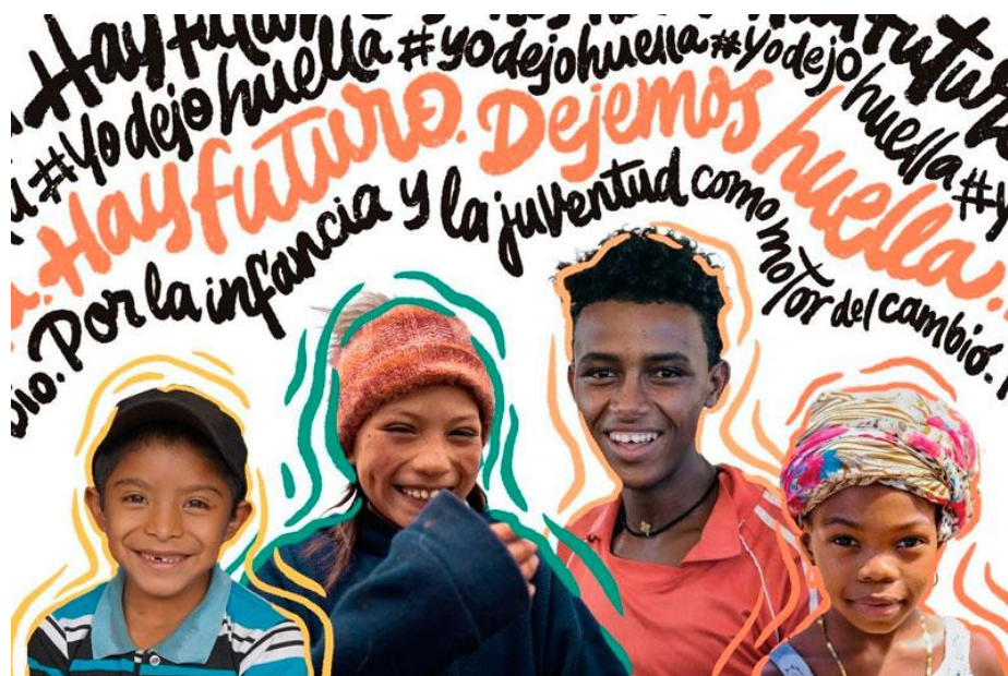
Imagen 19: El voluntariado digital para jóvenes de Ayuda en Acción.

Tal y como se expone a lo largo de este documento, la inmigración se encuentra consolidada como una de las cuestiones más espinosas con las que ha de tratar la comunidad europea. Frente al discurso predominante que generalmente relaciona la inmigración con una amenaza social, económica o cultural (Delgado, 2020) las ONG, las asociaciones de voluntariado y las iniciativas sociales se alzan en defensa de un tema tan sensible y mediático. El papel de éstas es clave en la creación de contrarrelatos publicitarios que, desde un enfoque solidario y defensor de los derechos humanos, abogan por la dignificación de inmigrantes y refugiados en el ámbito de la comunicación.