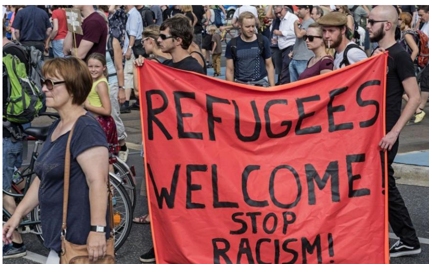
Imagen 7: Crisis migratoria y de refugio, el gran reto de Europa.