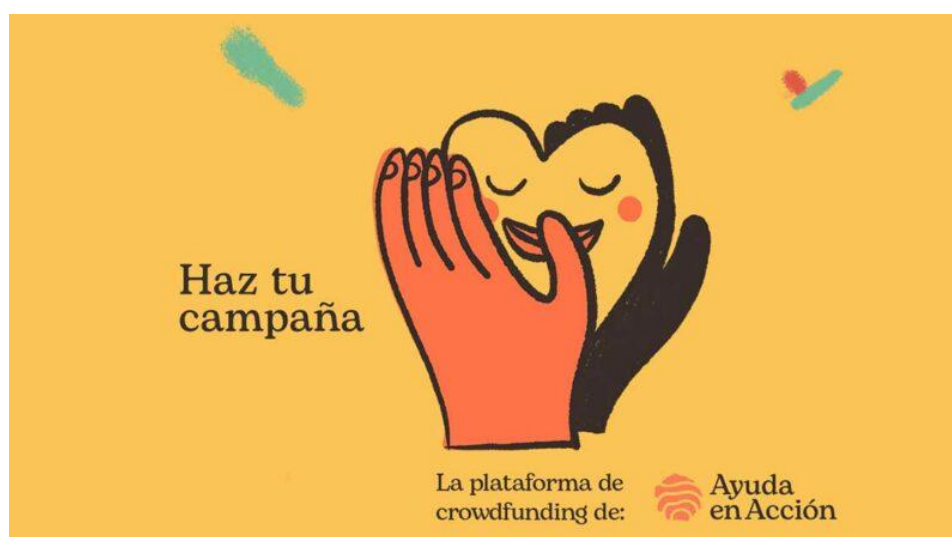
Imagen 25: Ayuda en Acción anima a los jóvenes a que hagan su propia campaña solidaria.