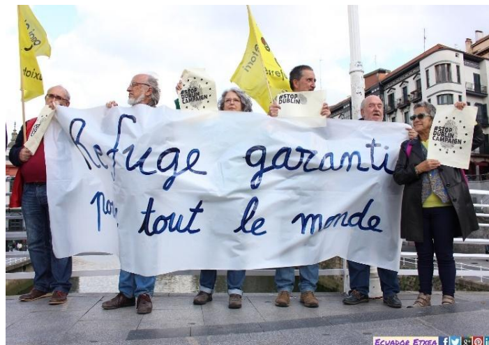
Imagen 2: Marcha ciudadana en contra del Reglamento de Dublín.

En Alemania, el nuevo gobierno formado con Friedrich Merz a la cabeza ha propuesto políticas migratorias más estrictas, lo que limitaría la reunificación familiar o aumentaría los requisitos exigidos en materia de nacionalidad. Con ello buscarían tratar de frenar el auge de la extrema derecha en el país (Euronews, 2024).