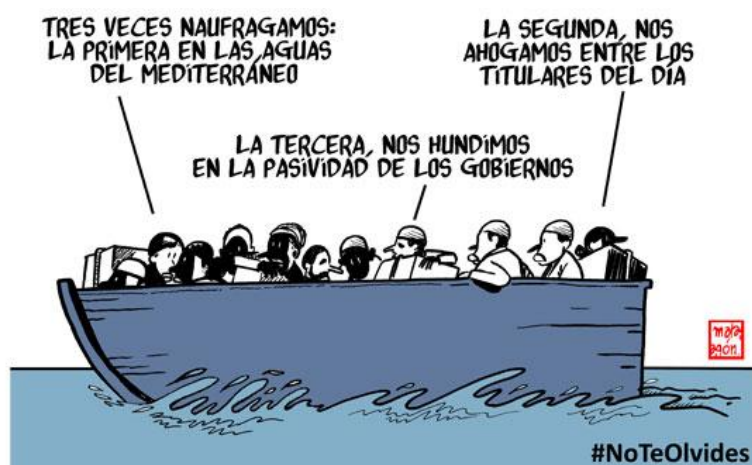
Imagen 16: Reclamo de 10 ONG y 30 artistas para que las personas refugiadas no caigan en el olvido bajo el lema #SinSalida.