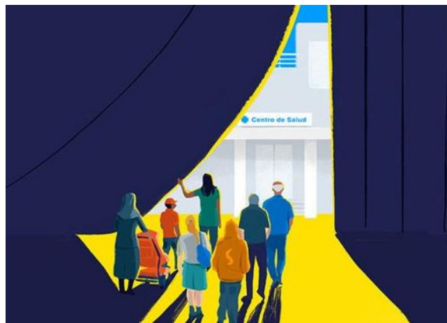
Imagen 21: Salud y Derechos Humanos.

En otro orden de ideas, se ha podido demostrar que el voluntariado aporta beneficios no solo en el plano logístico, sino también en lo que se refiere a la comunicación. El voluntariado se transforma en una voz al exterior, en un testigo directo que actúa como un canal fiable ante el discurso mediático que impera en nuestra sociedad. Tras comprobarlo en primera persona, me atrevería a confirmar que un ejercicio como este puede contribuir a humanizar la narrativa que suele rodear a una crisis de este calibre, contrastando con la despersonalización que en varias ocasiones muestran los medios tradicionales (Martínez Lirola, 2018; Moreno, 2022).