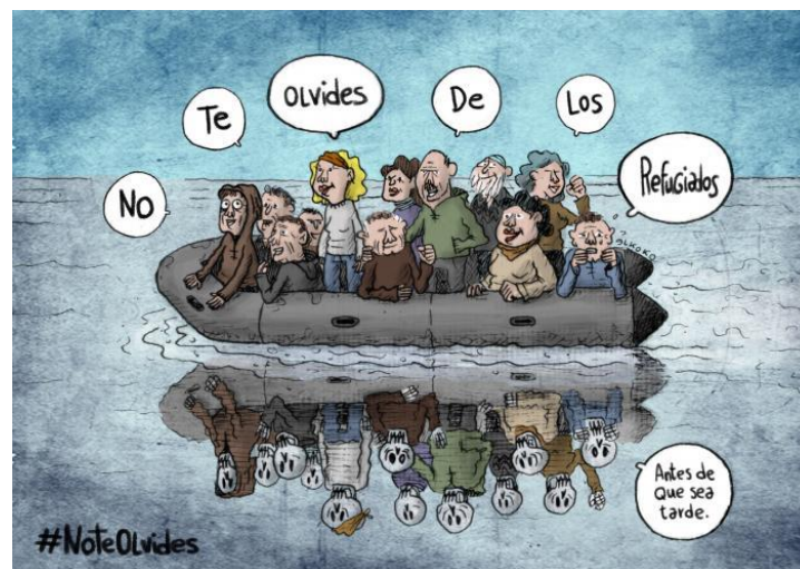
Imagen 14: “No te olvides de los refugiados”.