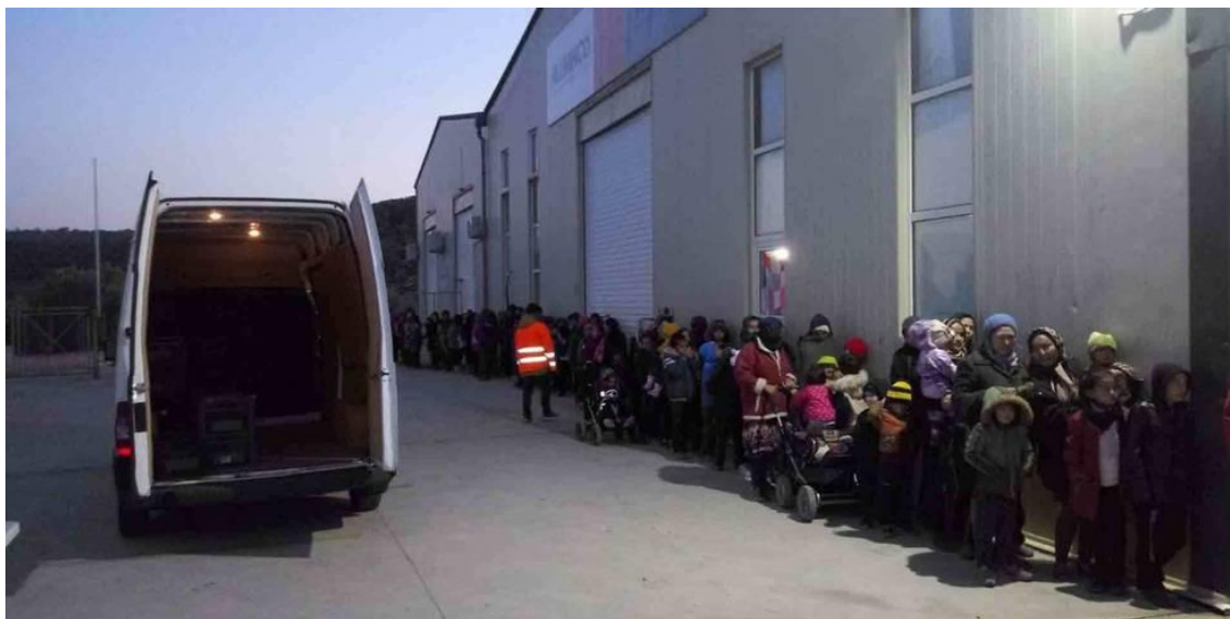
Imagen 13: la furgoneta que Zaporeak pudo adquirir para el reparto de comida gracias a la campaña de crowdfunding.