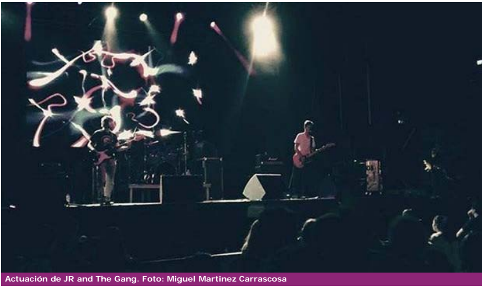
Actuación de JR and The Gang.