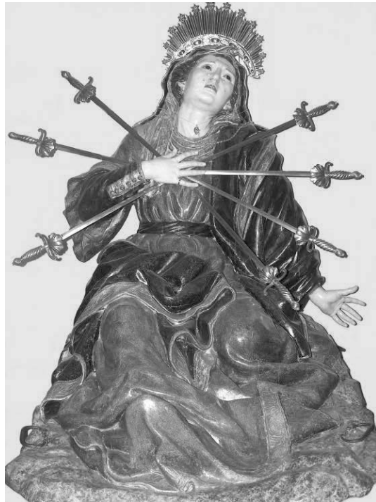
Fig. 7. Dolorosa . Domingo Esteban. 1755. Ermita del Santísimo Cristo de la Vera Cruz. Rasueros (Ávila).