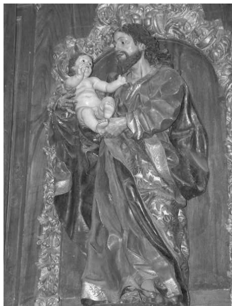
Fig. 2. San José con el Niño . Anónimo. Iglesia de Nuestra Señora del Carmen. Salamanca.

Pedro de Gamboa († 1730) 36 ejerció una intensa actividad y, aparte de las actuaciones señaladas, se conoce su intervención en los retablos de Machacón (Salamanca) y en el de Santa María del Berrocal (Ávila) en 1706-1708, así como en los laterales de la capilla de Nuestra Señora de las Angustias (ahora del Carmen) de la iglesia de San Martín de Salamanca entre 1713 y 1714, año en que también fabricó los retablos de las parroquiales de Tavera de Arriba y de Navas de Quejigal (Salamanca) según trazas de Joaquín de Churriguera. En 1726 hizo las andas y el trono de Nuestra Señora de los Reyes del santuario de Villaseco de los Reyes (Salamanca), en tanto que en 1729 fue designado para dirigir las obras del Colegio Militar de Calatrava 37 . Se pueden añadir a su