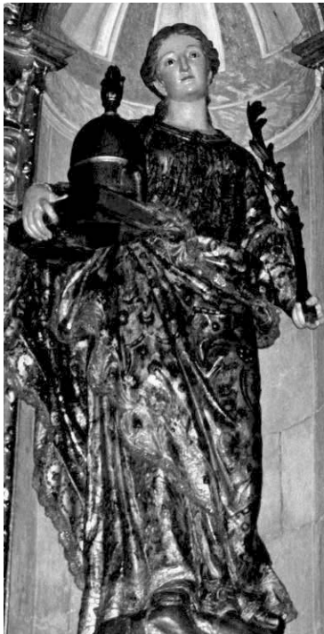
Fig. 6. Santa Eulalia de Mérida . Alejandro Carnicero. 1743. Catedral de Oviedo.

Manuel Benito fuese pariente de otro discípulo llamado Francisco Benito. Además, su aparición como testigo en el poder para testar de Manuela Mancio, la tercera mujer de Carnicero 99 , hace pensar en una relación cercana con el maestro, si bien ninguno de los artistas mencionados lo igualó en maestría ni tampoco llegaron a dominar el panorama escultórico de modo semejante. De hecho, en años posteriores volvió a recurrirse a talleres de Madrid en busca de obras de superior calidad, como las encargadas a Luis Salvador Carmona en torno a 1756 con destino a la capilla del Colegio de Oviedo y hacia 1760-1761 para el Colegio de la Compañía de Jesús y la Catedral 100 .