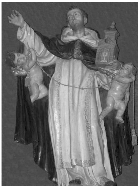
Fig. 1. Santo Tomás de Aquino . José de Larra. Hacia 1692. Iglesia de San Esteban. Salamanca.