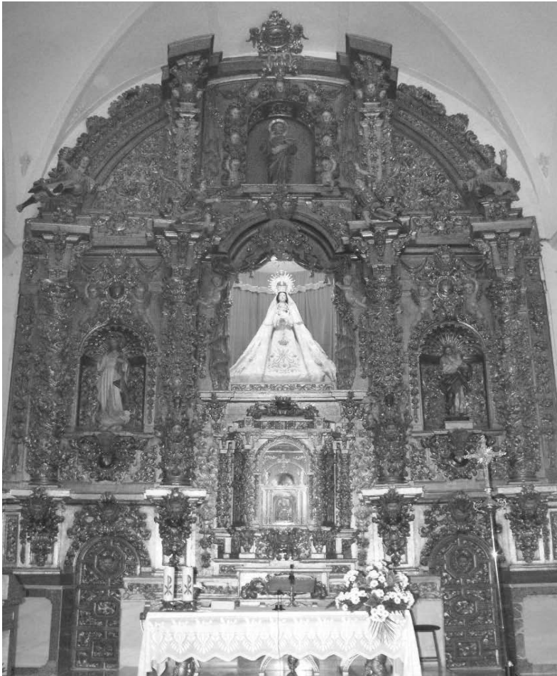
Fig. 4. Manuel Reinaldos, según traza de Miguel Martínez de la Quintana. Retablo del convento de San Pedro de la Paz de Salamanca. Hacia 1736. Actualmente en la iglesia de Tejares (Salamanca).

Los rumores sobre la falta de estabilidad de la torre de las campanas de la Catedral reunieron en Salamanca al ingeniero militar José Barcia, al arquitecto Valentín Antonio de Mazarrasa y, probablemente, a Pedro Moreau, que entonces trabajaba en el Fuerte de la Concepción de Aldea del Obispo (Salamanca), además de a Pedro de Ribera 59 , lo que coincidió con la renuncia de Alberto de Churriguera al cargo de Maestro Mayor del templo y su marcha de la ciudad en octubre de 1738, posiblemente tras concluir el retablo de la