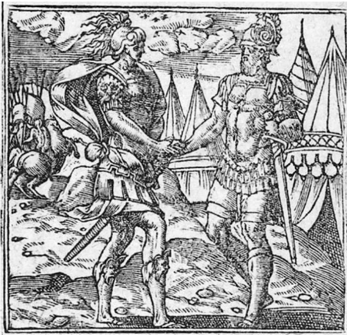
Fig. 2: Alegoría de la Concordia . Andrea Alciato, Emblemata (Lyon, imprenta de Guillaume Rouille, 1548), p. 39.

Frente al Consistorio se colocó la imagen de la Concordia . Esta aparecía representada por la unión de tres héroes representando a las naciones inglesa, portuguesa y española, con sus brazos entrelazados y con sus escudos de armas a los pies, simbolizando la fuerza basada en su unión y amistad. La representación estaba acompañada por un texto explicativo en latín: “ Faederis haec species id habet concordia signum / Ut quos jungit amor jungat et ipsa manus ” 21 . El texto fue tomado del emblema número XXXIX de Alciato, cuya imagen muestra a dos guerreros dándose la mano, señal de amistad y alianza (fig. 2). En el ejemplo vallisoletano, donde eran tres las figuras representadas, sus artífices debieron, además, inspirarse en el emblema CLXII, que mostraba a las tres Gracias 22 .