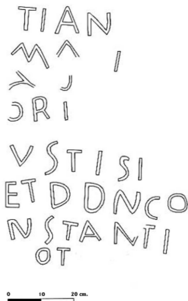
Fig. 5. Calco del texto del miliario del Parador Sinfioriano II

Para comprender la estructura del texto del epígrafe hemos tenido que empezar por el final. La presencia de la conjunción ET, lo que supone para los miliarios tetrárquicos una neta separación entre dos grupos de emperadores, y de la abreviatura DDN (aunque irregular, pues falta una N) que se refiere a la presencia de dos emperadores, indica que se quiere marcar una clara división entre el texto que va de la primera a la sexta línea y lo que sigue, donde tras la conjunción tienen que aparecer los nombres de por lo menos dos emperadores (Figura 5). De estos uno se conserva claramente y es Constancio, mientras que el otro, con toda probabilidad Galerio, no se conserva porque justo en esta línea se fracturó el miliario.