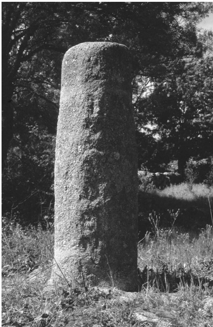
Fig. 4. El miliario del Parador Sinforiano II en su lugar de emplazamiento actual