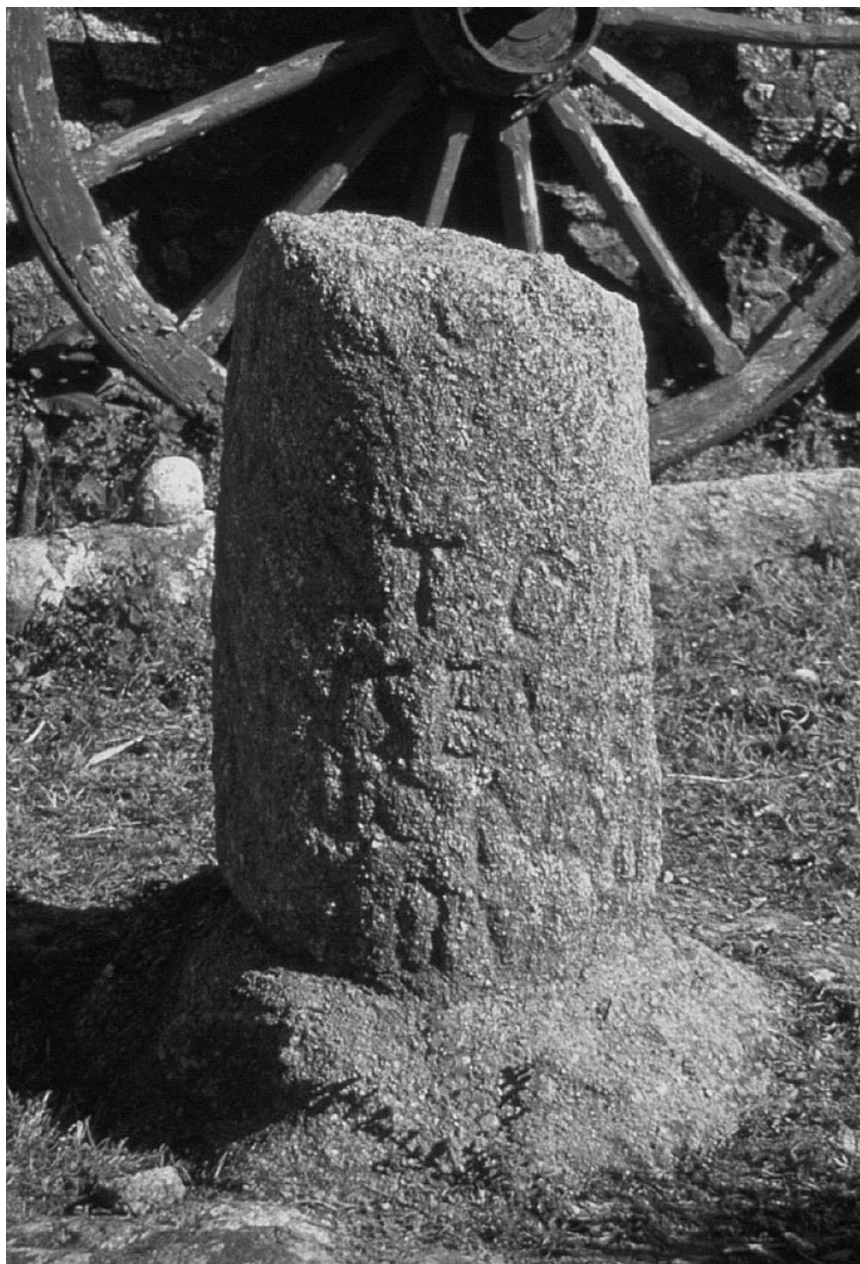
Fig.2. El fragmento A en su emplazamiento actual delante del Parador Sinforiano