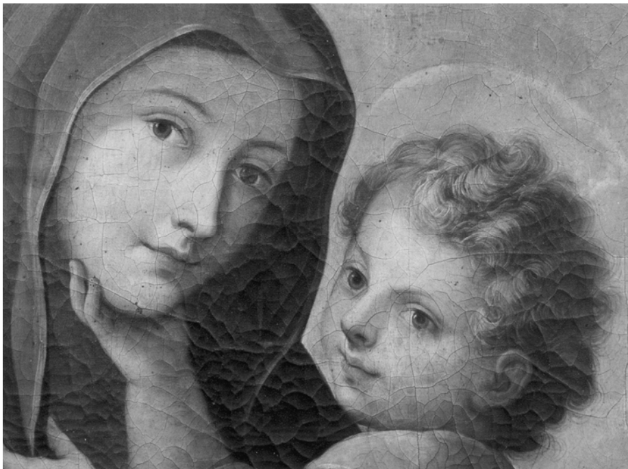
Fig. 5. Zamora. Monasterio de Santa María la Real de las Dueñas Dominicas. Pintura de la Virgen del Carmen (detalle). Antonio Sarnelli. 1748.