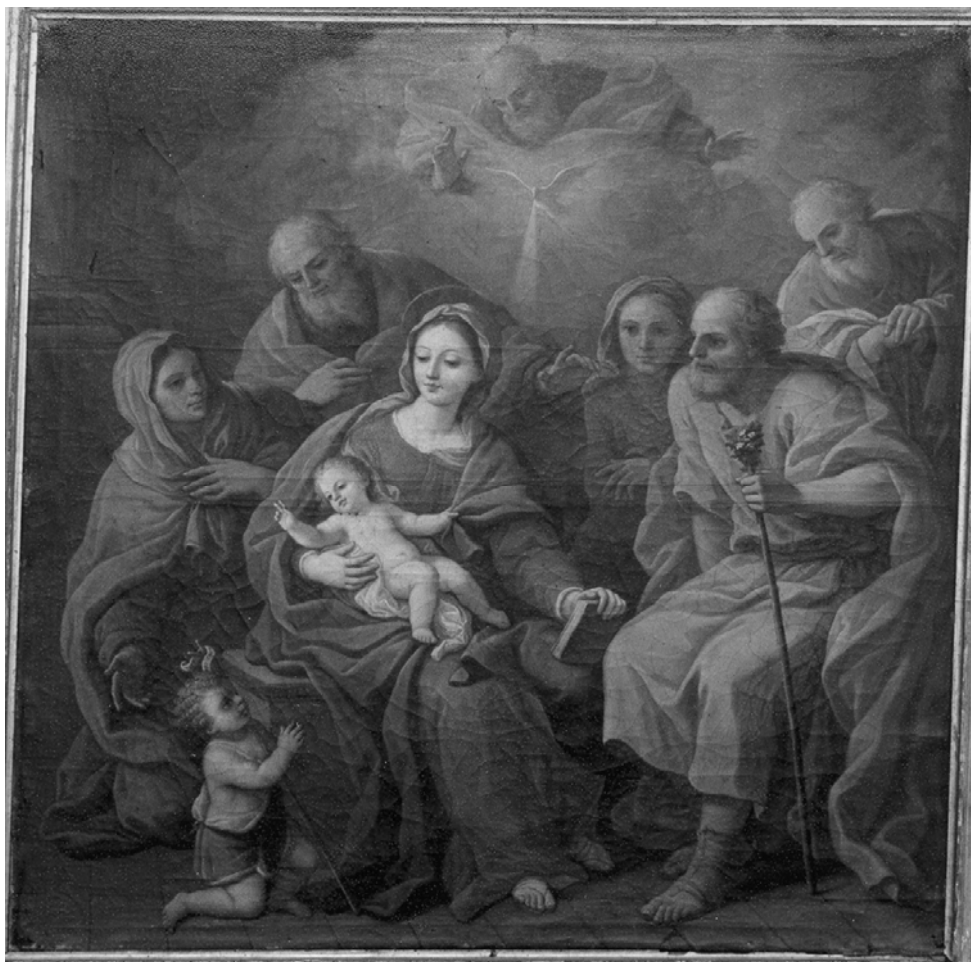
Fig.1. Zamora. Monasterio de Santa María la Real de las Dueñas Dominicanas. Pintura de la Trinidad con la parentela de Jesús. Antonio Sarnelli. 1748.