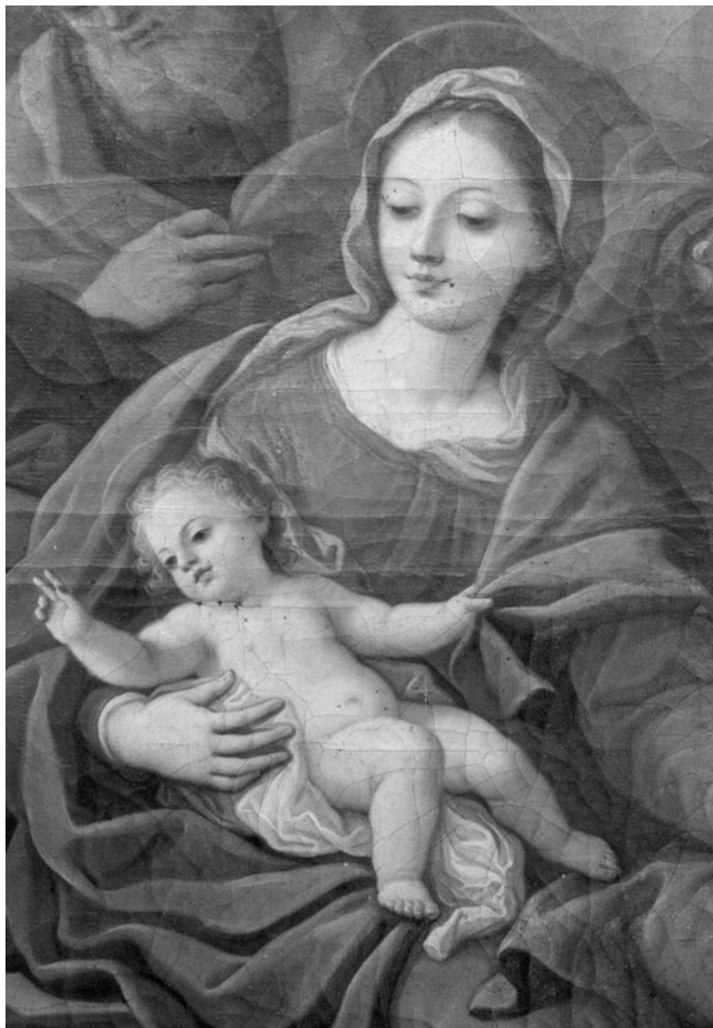
Fig. 2. Zamora. Monasterio de Santa María la Real de las Dueñas Dominicanas. Pintura de la Trinidad con la parentela de Jesús (detalle). Antonio Sarnelli. 1748.