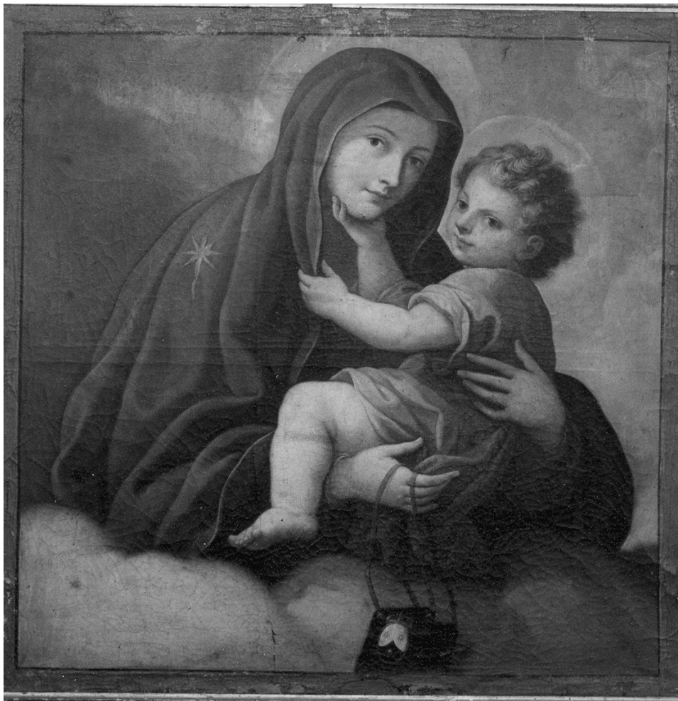
Fig. 4. Zamora. Monasterio de Santa María la Real de las Dueñas Dominicanas. Pintura de la Virgen del Carmen. Antonio Sarnelli. 1748.