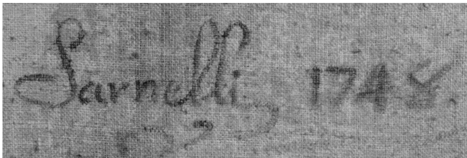
Fig. 3. Zamora. Monasterio de Santa María la Real de las Dueñas Dominicanas. Pintura de la Trinidad con la parentela de Jesús (detalle de la firma). Antonio Sarnelli. 1748.