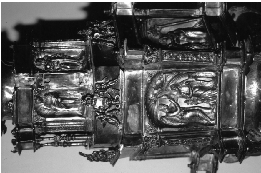
Fig. 3. Castroverde de Campos. Cruz parroquial (detalle de la macolla). Juan Magarzo.