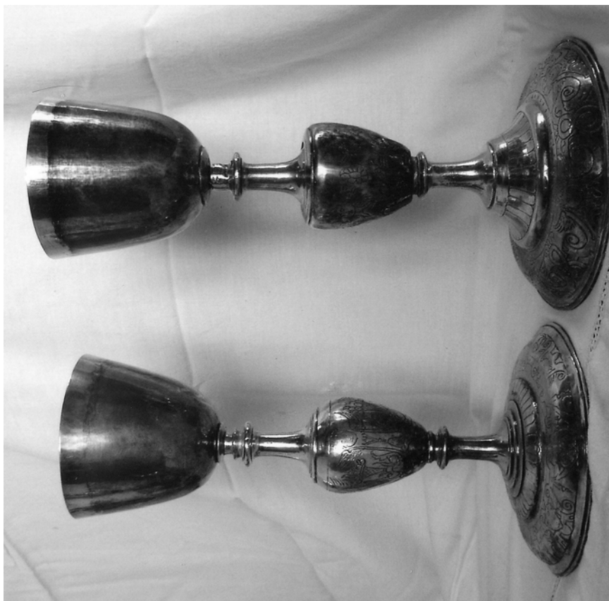
Fig. 5. Castroverde de Campos. Cálices. Juan Magarzo.