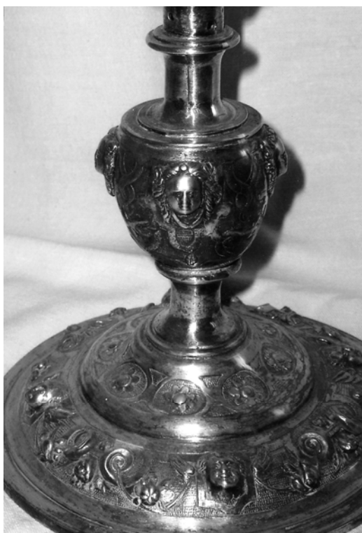
Fig. 8. Castroverde de Campos. Cáliz manierista (detalle del pie y nudo).