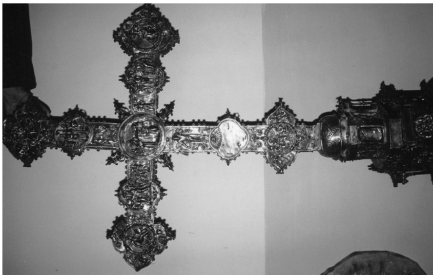
Fig. 2. Castroverde de Campos. Cruz parroquial (reverso). Juan Magarzo.