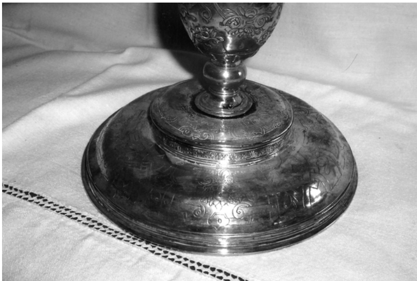
Fig. 7. Castroverde de Campos. Cáliz (detalle del pie). Antonio Borrego.