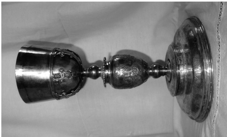
Fig. 6. Castroverde de Campos. Antonio Borrego.