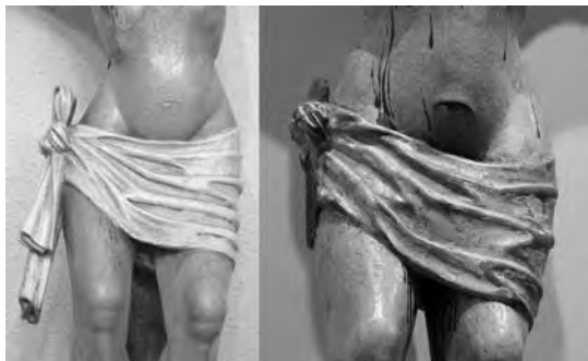
Fig. 5. Detalle de figs. 1 y 4.