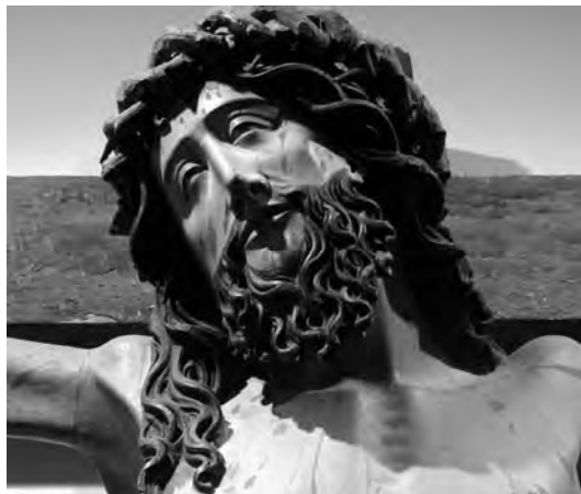
Fig. 4. Cristo crucificado (detalle). Alejo de Vahía. Museo de Santa María. Becerril de Campos. (Palencia).