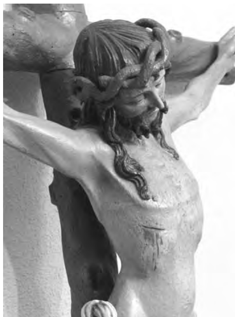
Fig. 2. Detalle de fig. 1.