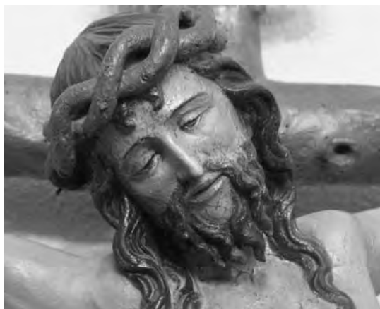
Fig. 3. Detalle de fig. 1.