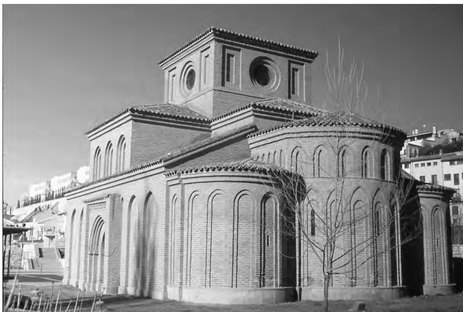
Fig. 2. Iglesia de Santiago del Arrabal. Salamanca (después de la restauración).