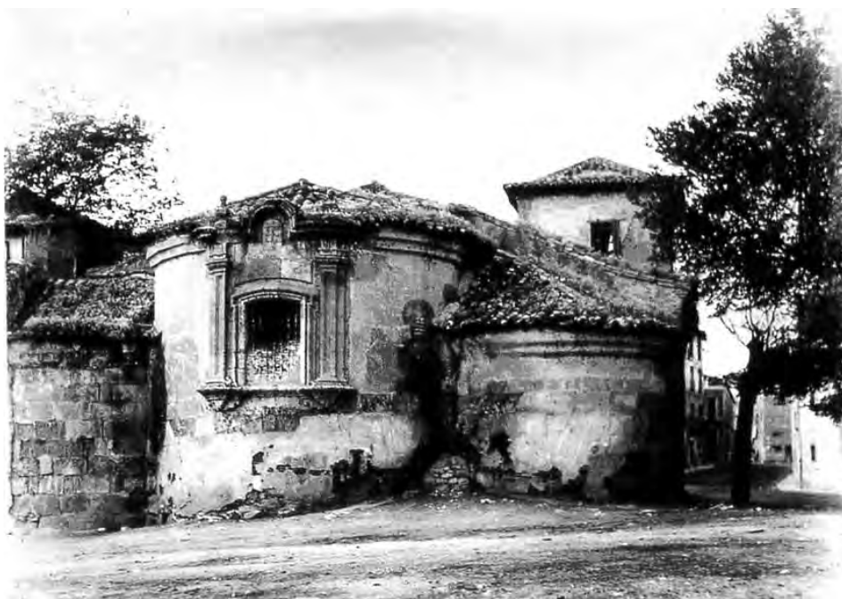
Fig. 1. Iglesia de Santiago del Arrabal. Salamanca (antes de la restauración).