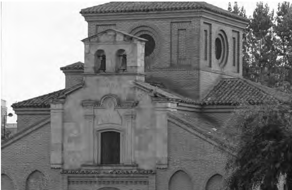
Fig. 4. Espadaña.