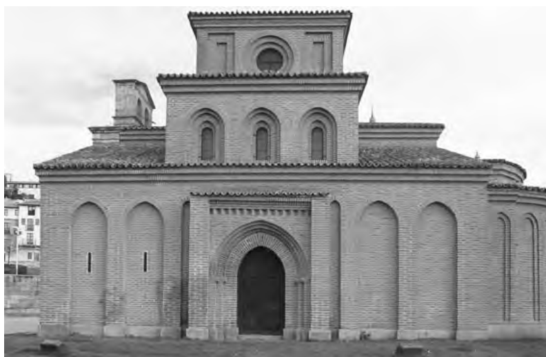
Fig. 6. Santiago del Arrabal. Fachada meridional.