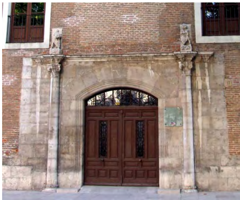
Fig. 3. Portada de la casa construida por Claudio de Cilly, actualmente parte de la sede de la Casa del Estudiante de la Universidad de Valladolid.

Torquemada, por un importe de 300.000 maravedís, que le fueron entregados por esta señora “en dineros contados en cinco mill e quinientos reales de plata e la resta en coronas de oro” 17 .