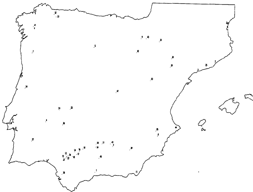
Fig. 2. Localización de las prospecciones realizadas en Hispania (referencia tabla 2).

El mapa de la figura 3 presenta altas densidades de población en centros como Emerita Augusta , Clunia y Augustobriga , que constituyen núcleos aislados situados en áreas poco urbanizadas de un posible habitat disperso. El caso de Emerita Augusta es muy significativo puesto que sugiere que la ciudad controlaba un amplio territorio sin ninguna competencia por parte de ningún otro centro urbano. De hecho, se sabe por Frontino (De controversis, 9) que al fundar la colonia (25 a.C.) se distribuyó el territorio colindante entre sus habitantes y aún sobró tierra. La división se realizó en parcelas de 400 iugerum , basadas en una unidad de 20x40 actus ( Higinio, De cond. agr. , 135.15), y la tierra restante se destinó al uso público, tanto pastos como bosques ( Frontino, De controversis, 37; 44.5; 46.16 ). La información de todos estos textos viene confirmada por los signos de centuriación observados en la fotografía aérea [Corzo, 1977; López Paz, 1994, 103-105], así como la presencia de cipos ( termini Augustales ) en Valdecaballeros (CIL II.656) [Stylov, 1986, 307], que demuestran que el territorio de la colonia era enorme, alcanzando unos 14.400 Km 2 [Wiegels, 1976; Canto, 1989]. De hecho, Emerita incluso poseía tierras en otros territorios vecinos, que se conocen como praefecturae , y se atestiguan en las comunidades de los Muliacenses y Turgalienses ( Higinio, De Lim. Contr. 171, 6-10).