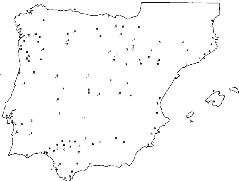
Fig. 1. Localización de las principales ciudades romanas en Hispania (referencia en tabla 1).