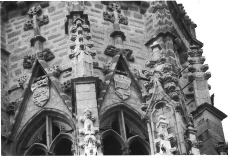
3 y 4. Toledo, coronamiento de la torre. Cuerpo octogonal con detalle de la decoración