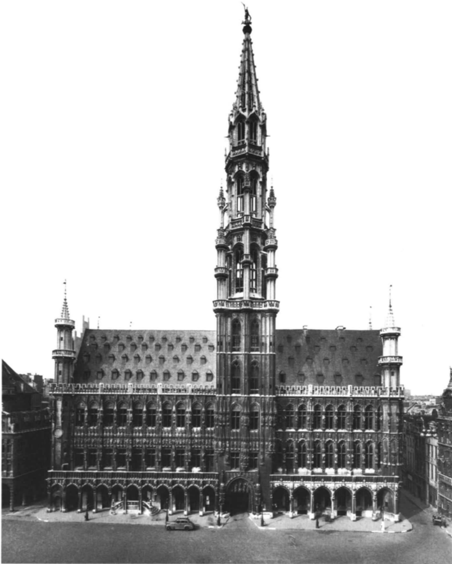
5. Bruselas, fachada del ayuntamiento con el «belfort».