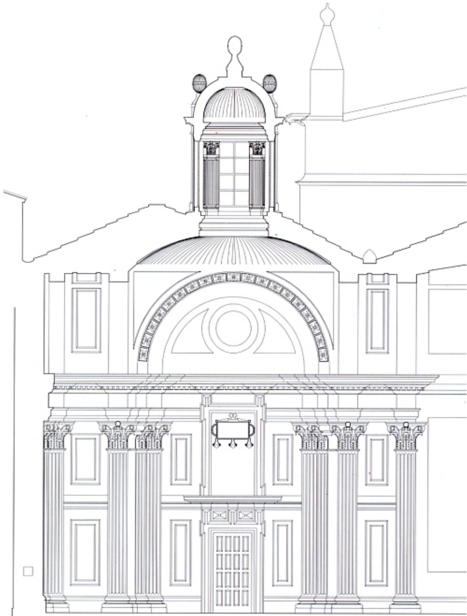
CAPILLA DE LOS VIGILES