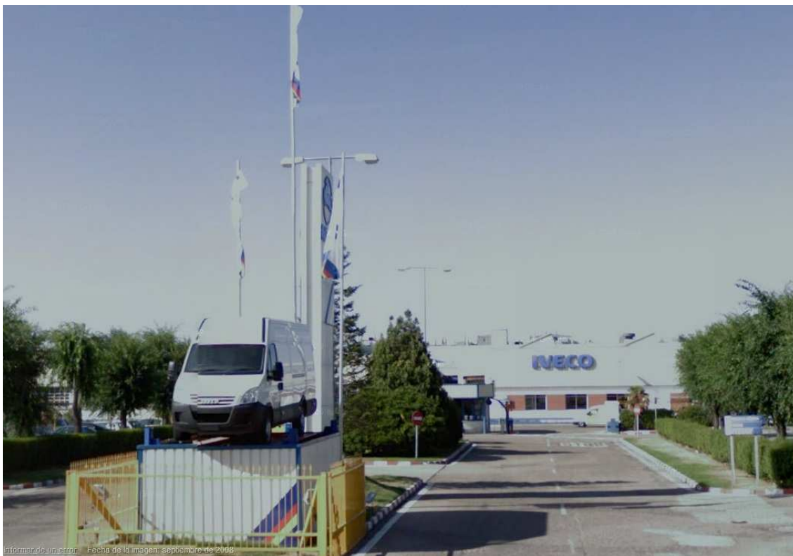
Ilustración 1: Acceso a las instalaciones de Iveco España S.L., planta de Valladolid

El desarrollo de las prácticas ha tenido lugar en la Unidad Operativa de Pintura (U.O.P.) de Iveco España S.L. planta de Valladolid, ubicada en la Av. Soria, Km 2,5. 47012 VALLADOLID - España.