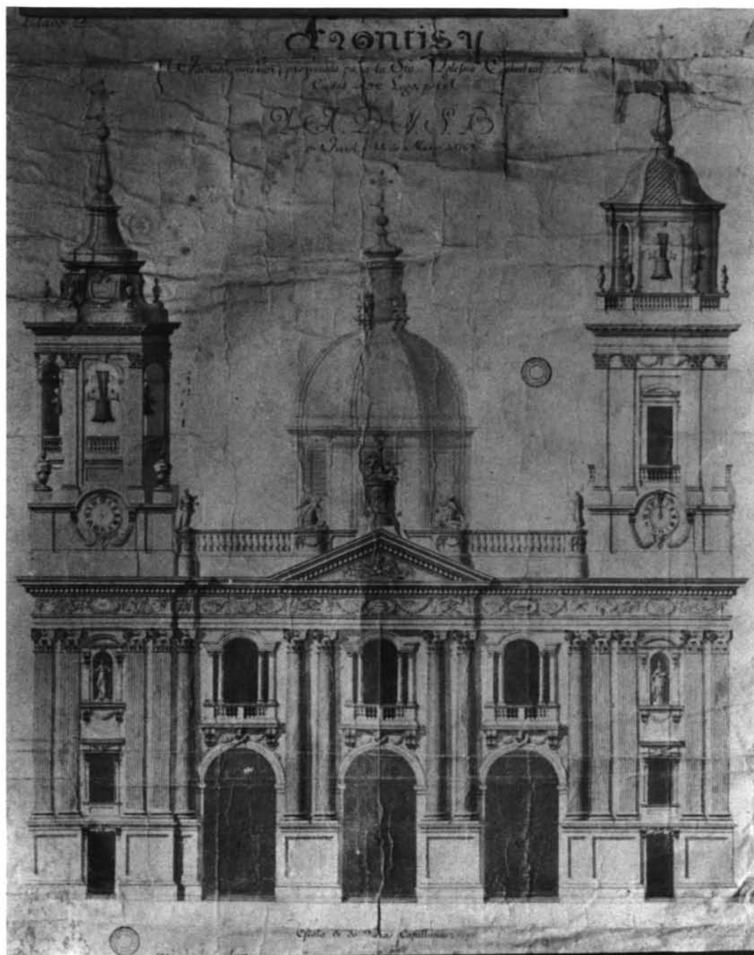
Lugo. Catedral. Alzado de la fachada principal, por Julián Sánchez Bort.