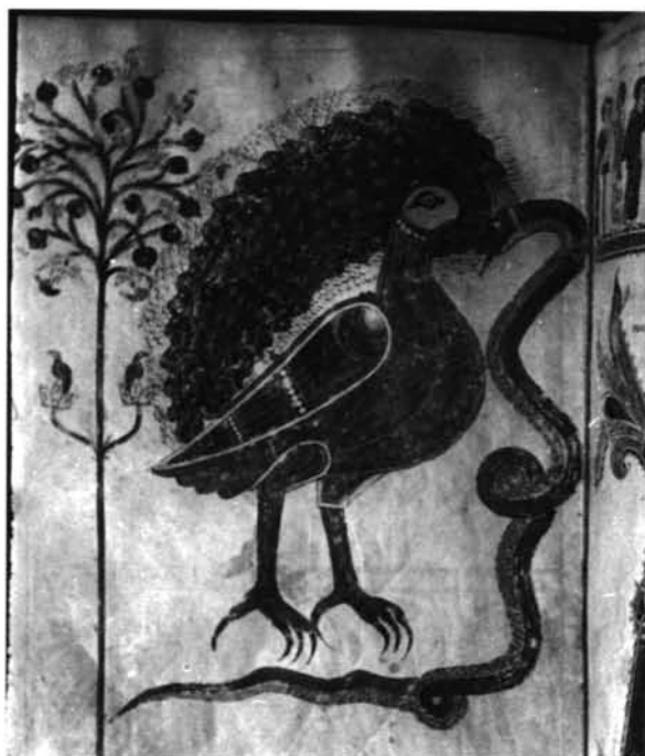
1. Constantinopla. Palacio imperial. Mosaico. Aguila y serpiente.—2. Beato de Gerona. La nube de polvo.