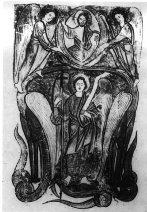
1. Biblia segunda de San Isidoro de León. La nube de polvo casi ha desaparecido.—2. Beato de Manchester, mal comprendida en el Románico, la nube de polvo adopta la estructura de un tejado.—3. Beato de las Huelgas de Burgos. Se ha perdido la vieja tradición y se produce un sincretismo, entre la serpiente del simbolismo de la Encarnación y el Angel apocalíptico, más la contaminación de la iconografía de San Miguel.