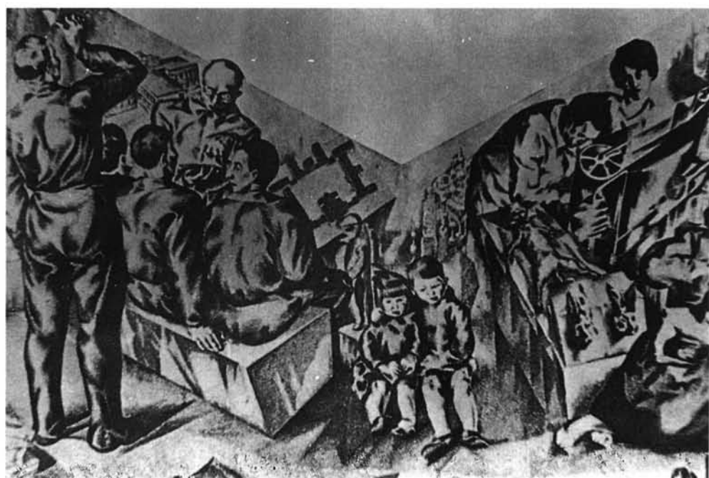
1 y 2. Frescos para el Pabellón de Gobierno de la Ciudad Universitaria de Madrid (1932), por Luis Quintanilla.