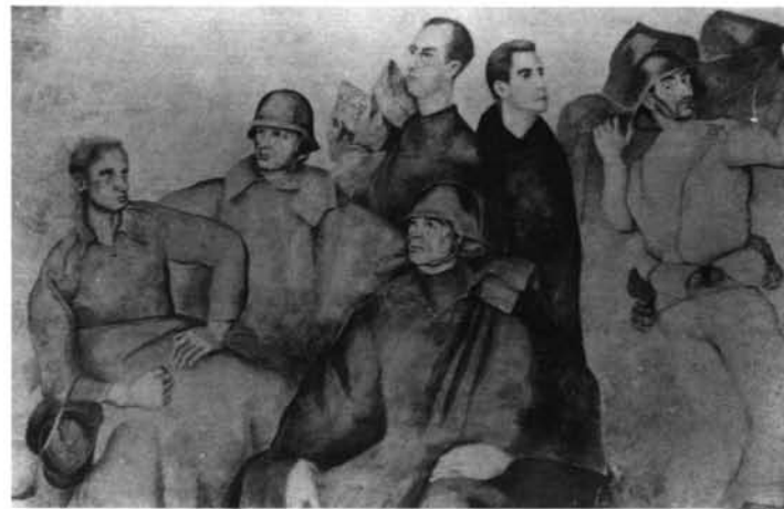
Frescos para el Pabellón Español de la Exposición Universal de Nueva York (1939), por Luis Quintanilla. 1. Dolor.—2. Fuga.—3. Destrucción.—4. Soldados.