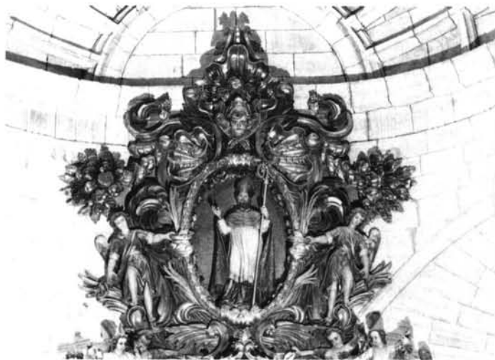
Orio (Guipúzcoa). Iglesia parroquial. Retablo mayor. Atico.