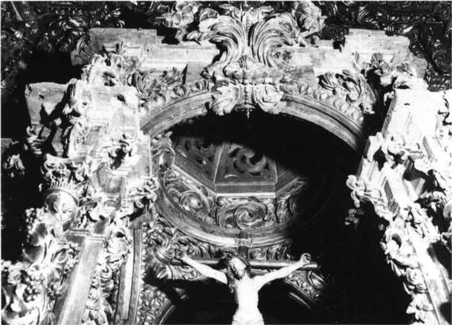
Orio (Guipúzcoa). Iglesia parroquial. Retablo mayor; conjunto y detalles.