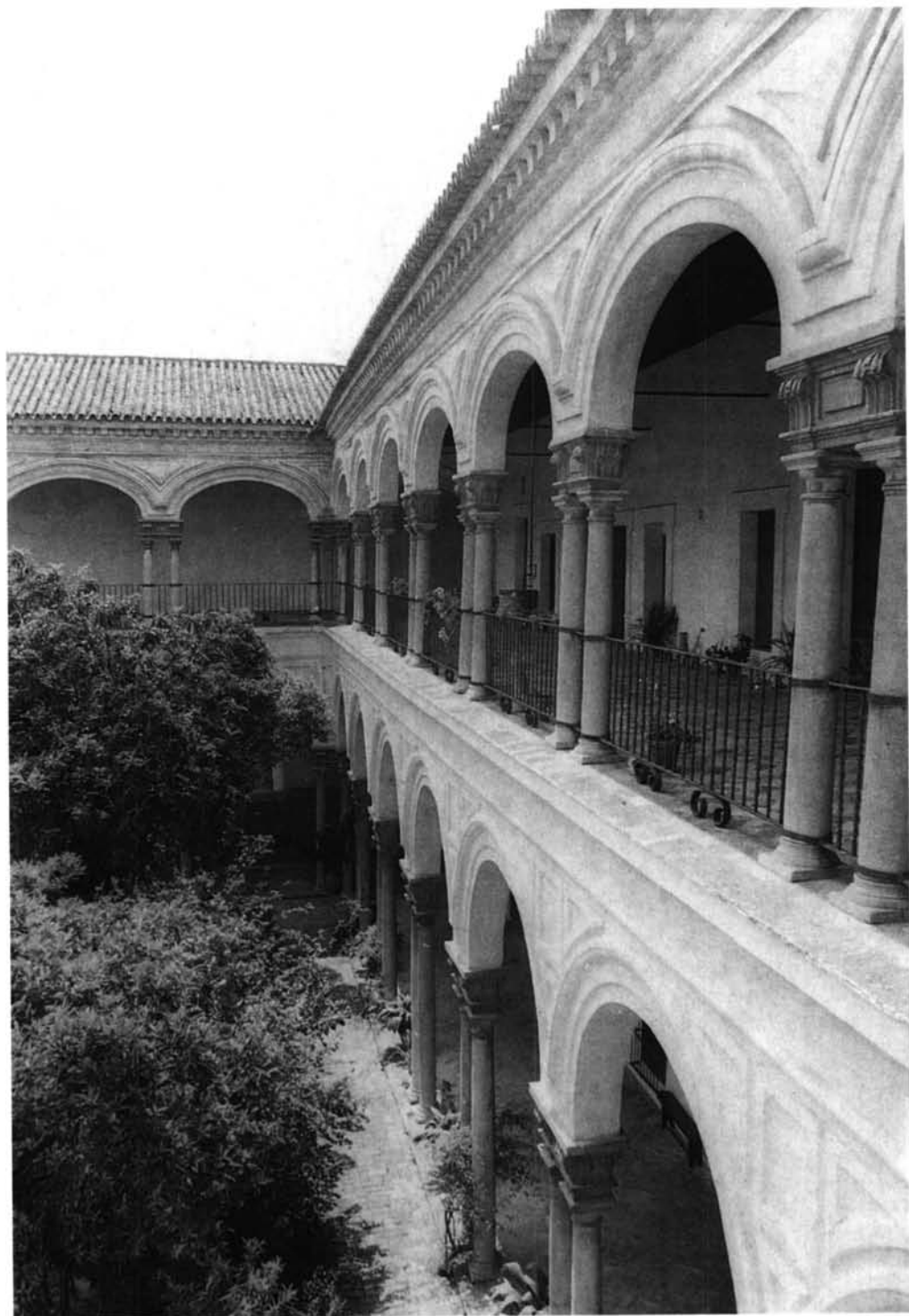
Sevilla. Monasterio de San Clemente. Claustro principal.