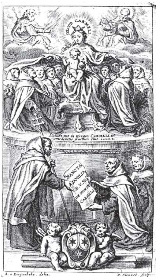
Fig. 2. Sagrada Familia en el Carmelo. Pierre Clouwet.

penbeek, para el Speculum Carmelitanum “a la séptima edad del mundo, nacerá la Virgen inmune de pecado original, la cual siendo virgen dará a luz al Redentor (Jn 44, Patr. Jeros. cc 39 y 40)”. La pequeña nubecilla, portadora de lluvia después de largos años de sequía (1 Re 18, 42-45), se interpreta como un símbolo de María, cuya imagen completa la estampa de Lommelin. A la Virgen, que fue elegida como morada del Mesías y su primer templo, le consagró Elías la Orden 37 y le prometió erigir una iglesia en el Carmelo: “De vôte Pureté je veux suivre l'exemple, / Je soumets tout mon Ordre à vos aimables fers, / Et dessus le Carmel je vous dedie un Temple” 38 .