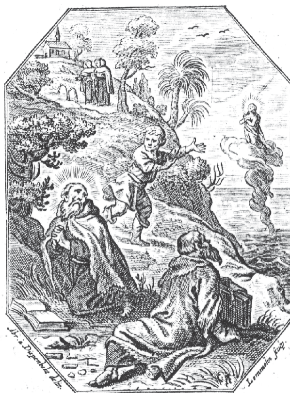
Divā tuum veneror nubis sub imagine Numen, Exemplumque tuum Virginitatis amo. Templa dico, ritumque novam tibi, consecro, gensque ELIANA simul et MARIANA mea est.