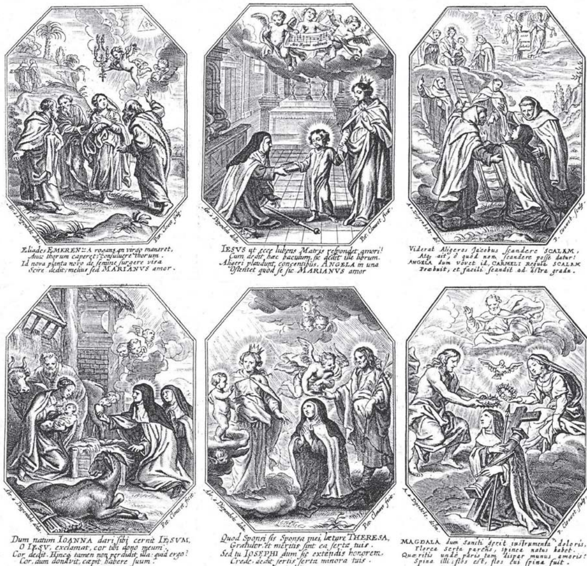
Fig. 9. a) Santa Emerenciana visita el Carmelo. b) La beata Ángela de Bohemia recibiendo un libro de manos del Niño Jesús y un báculo de María. c) La beata Ángela Arena subiendo la escala de la salvación. d) La bienaventurada Juana ofreciendo su corazón a Cristo. e) Coronación de santa Teresa. f) Doble coronación de santa María Magdalena de Pazzi. Pierre Clouwet.

Doctrina , que fueron seguidas por la Vita Effigiata Della Serafica Vergine S. Teresa di Gesù fondatrice dell'Ordine Carmelita Scalzo grabada de Arnol van Westerhout en 1715. En las series de Roma y Lyon aparece la corona como premio por lo que había hecho a favor de María (“S. V. Teresia fulgenti corona redimitur / a Domino ob reparatum purissimae suae / Matris Ordinem”, La santa virgen Teresa es recompensada por el Señor con una brillante corona, por restaurar la Orden de su purísima Madre) y cambia en la versión de Westerhout, en la que se asocia a los desposorios (“Seraphica Virgo Theresia ut dilectissima supre / mi Regis Sponsa coronatur”, La seráfica virgen Teresa es coronada como esposa queridísima del supremo Rey), aunque mantiene la misma imagen de las series seiscentistas de santa Teresa arrodillada delante de Cristo en el momento que la corona en presencia de María.