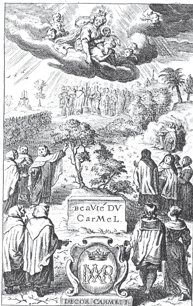
Fig. 1. Beauté du Carmel . Cornelio van Kaukercken. Les peintures sacrees du Temple du Carmel . 1660. Biblioteca del Teresianum. Roma.