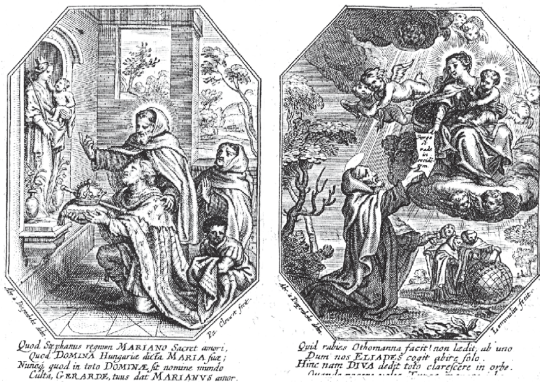
Fig. 6. a) San Esteban de Hungría ofreciendo su reino a María. Pierre Clouwet. b) San Bertoldo de Lombardía recibiendo el encargo de dirigirse a Occidente. Adriaan Lommelin.

En la obra que comentamos Bertoldo de Lombardía aparece en una estampa realizada por Adrian Lommelin, en el momento de recibir el encargo de María de dirigirse a Occidente -“Surge / et / vade /in / occide(n)/tem” 51 - con la promesa de que “Pour un lieu que tu perds, je t’en prepare cent, /et ton Nom fera bruit jusqu’aux deux bouts du monde” 52 ; lo que es ilustrado en un segundo plano, con unos carmelitas que preparan el viaje midiendo un globo terráqueo (fig. 6b).