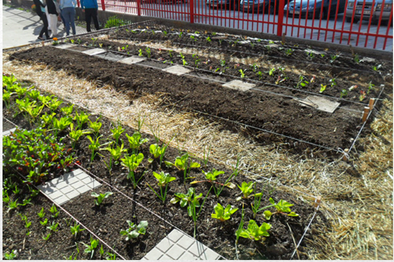
IES Pintor Luis Sáez - BURGOS Huerto Ecológico