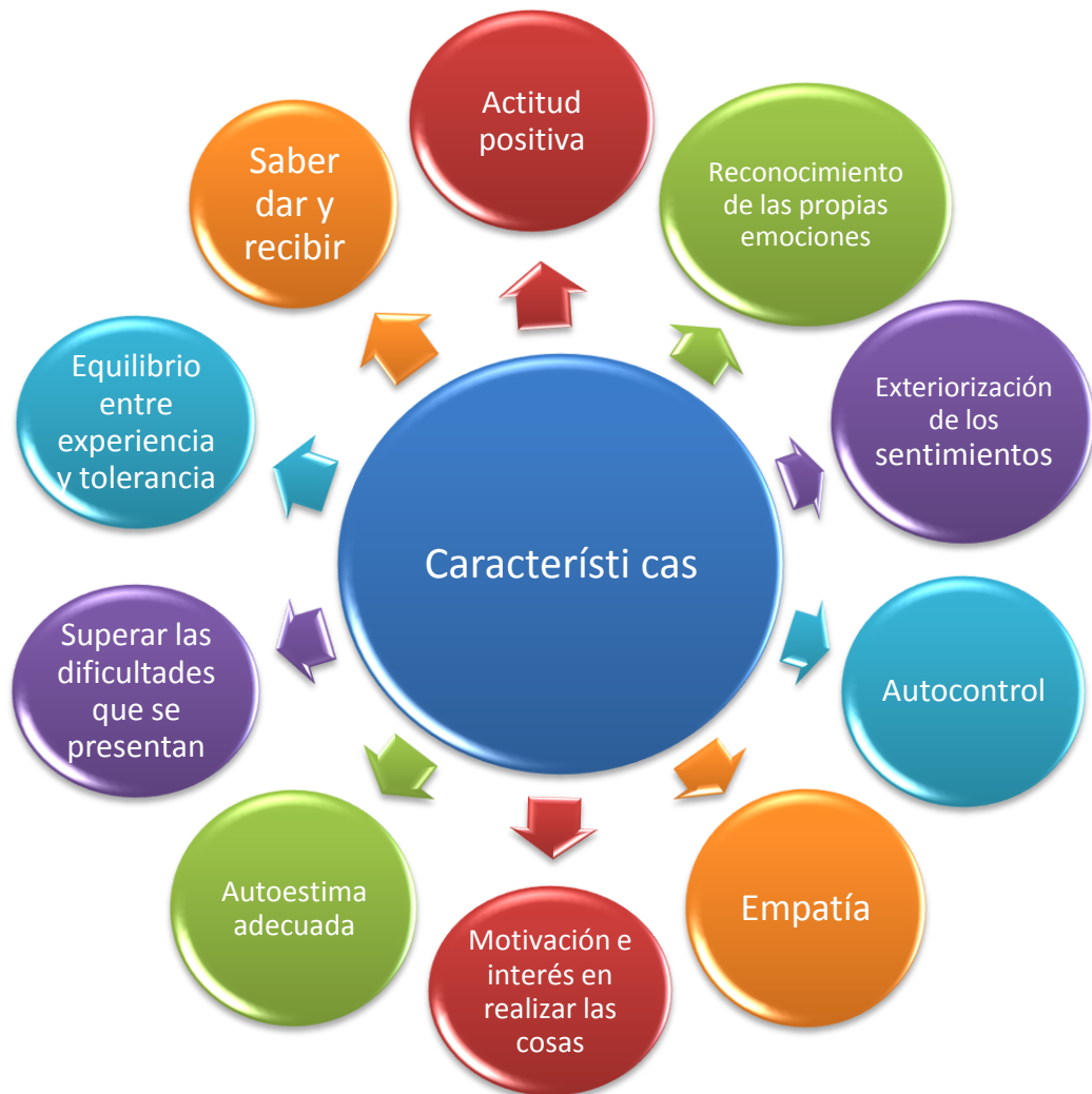
Figura 2. Característica de una persona socialmente Inteligente (Elaboración propia)

algunas de las características que establece como importantes son las que se muestran en la figura 2.