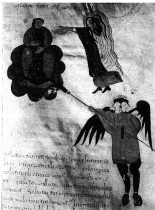
1. Beato de Gerona. Fol. 16 v.º—2. Beato de Gerona. Fol. 17.—3. Biblia de León. Fol. 181 v.º— 4. Biblia de León. Fol. 181 v.º