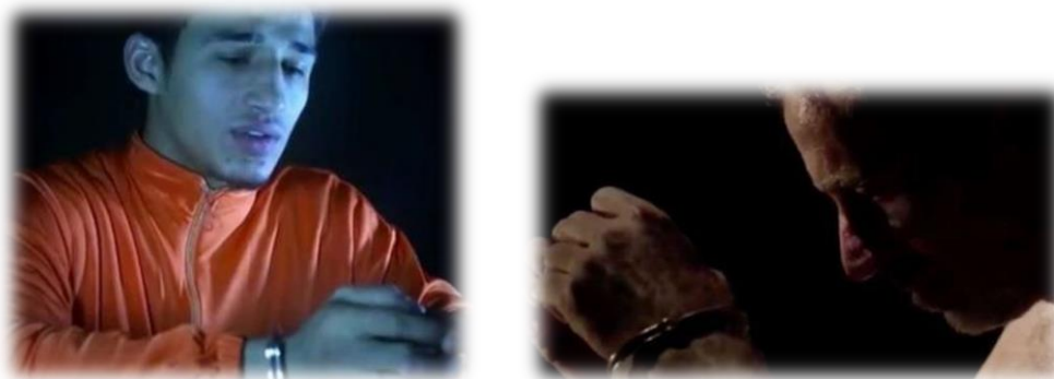
3.4 Comparación de un fotograma de uno de los interrogatorios de rehenes del E.I. (izquierda) con un fotograma de la serie del espía americano Homeland (derecha).

11 Se basan en imágenes de la cultura occidental como series, videojuegos como Call of Duty o películas como Saw o Matrix. Por eso los espectadores occidentales se sienten atraídos por sus videos y por su causa. Quieren ser los protagonistas de su propia película, de su videojuego, etc.