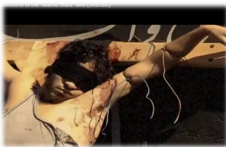
4.2 Fotograma del polémico video Welcome to the Islamic State

El canal de YouTube cuenta con muy pocos suscriptores, concretamente con 3014 personas. Pero alguno de los videos publicados en el canal cuentan con cientos de miles de visitas. Uno de los más vistos a la par que polémico es el que lleva el nombre de Welcome to the Islamic State (Bienvenido al Estado Islámico). En el video se muestran imágenes de las atrocidades que acomete el E.I. y una sucesión de frases irónicas tales como: “Where you can learn useful new skills for the Ummah! “(Dónde puedes aprender habilidades útiles para la comunidad), “Crucifying and executing Muslims “(Crucificar y ejecutar Musulmanes) o “Travel is inexpensive because you won’t need a return ticket!”(El viaje es barato, porque no necesitas ticket de vuelta).