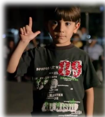
3.1 Niño realizando el saludo del E.I.

El enemigo, también debe ser conocido bajo un solo concepto. E.I. tacha a sus adversarios de infieles, independientemente de su religión, procedencia geográfica, etc. Si estás en contra de lo establecido por la sharía (ley islámica) eres infiel y mereces morir.