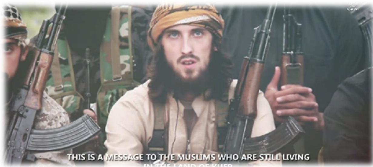
2.4 Fotograma del video propagandístico mencionado anteriormente, donde aparece el ciudadano francés: https://ia800305.us.archive.org/28/items/nasheed_fr/nasheed_fr.mp4

Todas las imágenes que nos muestran esos videos colgados en la plataforma, tiene un componente que los hacen más seductores para el espectador. Nos referimos con esto a su estética hollywoodiense. Hacen de la muerte un espectáculo. Reflejo de esta última afirmación es el video de la decapitación de 21 cristianos a orillas del mar en Libia. 5