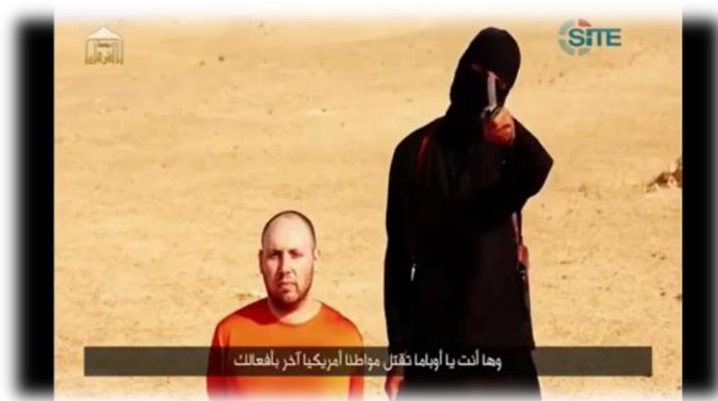
4.1 Fotograma de la ejecución de Steven Sotloff: https://www.youtube.com/watch?v=siFuAn4yc7E

El Estado Islámico divulgó en Internet un video con el título “Un segundo mensaje para América” . 12 En el video se muestra a un ciudadano británico totalmente cubierto de negro decapitando al periodista estadounidense de 31 años Steven Sotloff. La muerte de éste se anunció en un video anterior en el que también se decapitaba a otro periodista americano llamado James Foley.