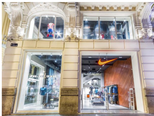
Figura 3.9. Tienda insignia Nike, Madrid

Pero sobre todo, esta marca juega en su tienda insignia con su conocida zapatilla Air Max, ya que cuenta con todas sus versiones y posibilidades factibles. Han sabido aprovechar la moda runner que lleva tiempo surgiendo entre personas tanto que hacían deporte o apenas hacían nada, y uno de los accesorios más importantes es un buen calzado, por ello se han convertido en una gran tendencia de esta temporada.