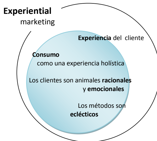
Figura 2.1. Características clave a diferencia del marketing tradicional

Fuente: Libro Experiential marketing, Bernd H.Schmitt