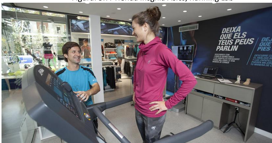
Figura: 3.7. Tienda insignia Asics, Running Lab

Estas son unas instalaciones innovadoras y de primer nivel, debido a que por primera vez se ha puesto al alcance del público los sistemas biomecánicos más avanzados.