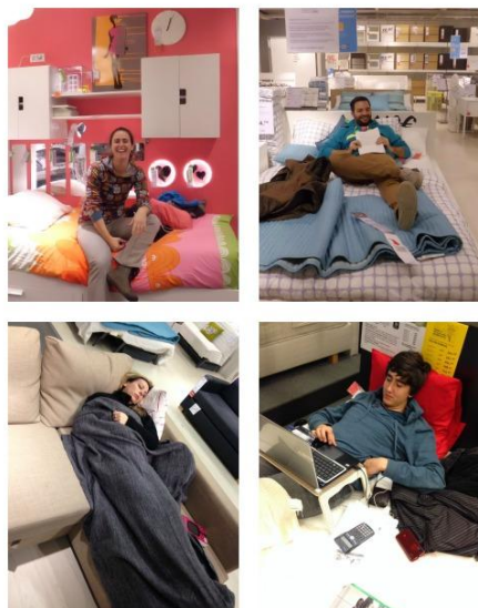
Figura 3.4. Tienda Ikea

El año pasado, en España, concretamente en una tienda de Sevilla. Quisieron celebrar el décimo aniversario de una manera diferente, regalando los que participaran en la acción algunos artículos de la empresa como un colchón, dos sofás, un juego de mesa y cuatro sillas y dos camas. Pero para conseguir los artículos gratis tenían que ser titulares de la tarjeta Ikea family y llegar el primero al artículo que ofrecían en la prueba y sentarte sobre ellos sin levantarte durante 10 horas seguidas, sólo con un descanso de quince minutos pasadas las 5 horas. Obviamente a los participantes no les faltó comida, ni bebida durante la estancia, además de entretenerse con revistas o hablando con los propios trabajadores.