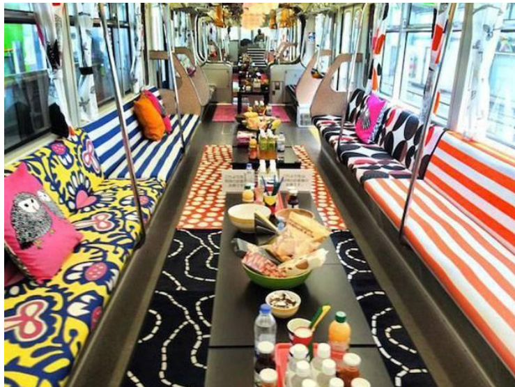
Figura 3.2. Vagón de metro de Tokio