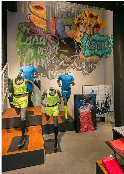
Figura: 3.8. Tienda insignia Nike, Madrid

En este caso, a diferencia de las tiendas insignia de Asics, cabe destacar que Nike contó con la creatividad del conocido grupo de artistas urbanos Boa Mistura, sus obras suelen desarrollarse en espacios públicos y tienen como objetivo mandar mensajes positivos en diferentes lenguas y culturas. Por ello, Nike se ha decantado por sus diseños, dada la energía que transmiten, lo cual está muy relacionado con el deporte. Gracias a la decoración realizada con graffitis en las paredes, se consigue un estilo urbano, cercano y moderno. Entre los diseños del colectivo creativo se encuentra el siguiente mural.