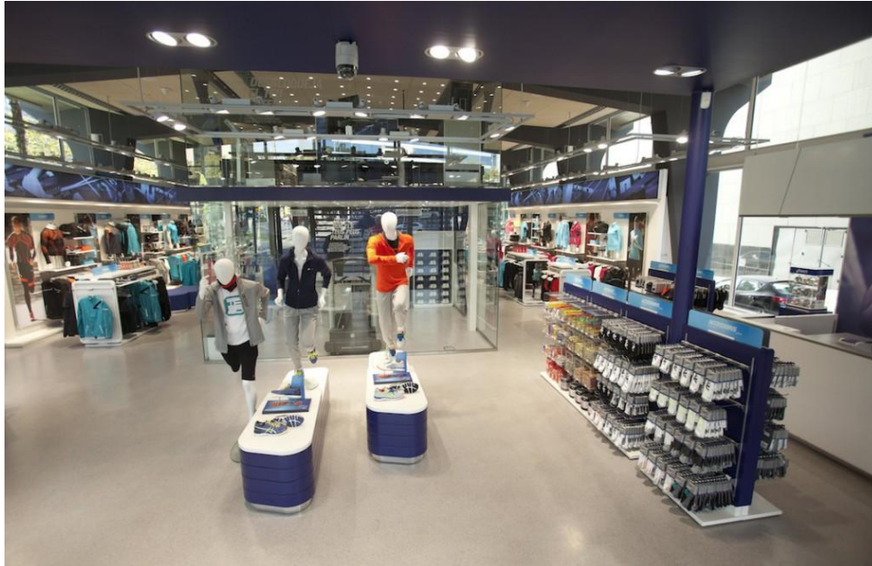
Figura 3.6. Tienda insignia Asics, Barcelona

Asics es una marca de deportes japonesa, la cual ha abierto una tienda insignia en España. Esta tienda, está situada en la ciudad de Barcelona, llegó hace 3 años a España y ocupa 472 metros cuadrados, divididos en tres pisos. Como he hablado en el punto anterior, esta tienda cumple las características vistas, ya que además de su gran tamaño está situada en una avenida muy concurrida de la ciudad condal. Ofrece un gran catálogo, en el cual plasman la colección de calzado y vestuario. En su establecimiento también cuentan con servicios avanzados y asesoramiento profesional para corredores. Aunque parezca una tienda centrada sólo en el running, también cuenta con las últimas novedades en pádel, tenis, hockey hierba y voleibol.