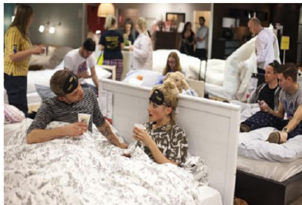
Figura 3.5. Tienda Ikea

Sin embargo, Ikea no se queda ahí, sino que va un paso más allá en la búsqueda de conocer al consumidor y llamar su atención. En esta misma campaña, dentro de sus tiendas los clientes se podían encontrar pequeñas obras de teatro que representaban acciones cotidianas del hogar o por ejemplo, poder ser maquillado por un profesional en la zona de baños de la tienda. Además, esta campaña tuvo una duración de dos meses.