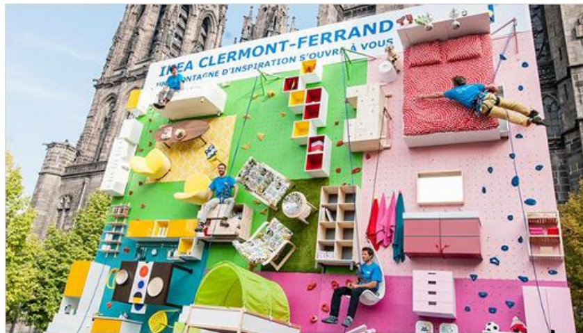
Figura 3.3. Fachada, rocódromo de Ikea