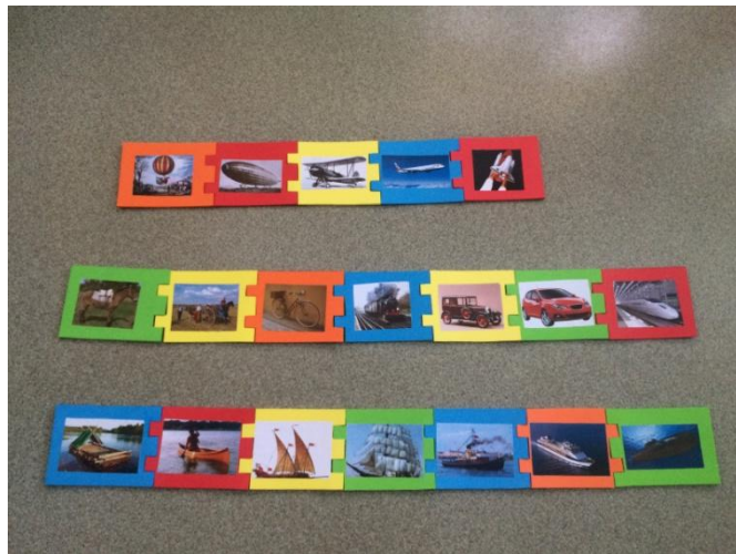
Puzzles sesión 6