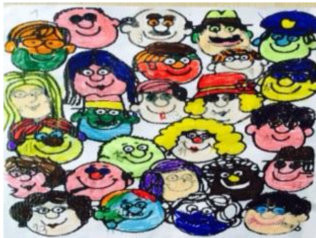
Pieza del cuento coloreada por los niños para la sesión 9