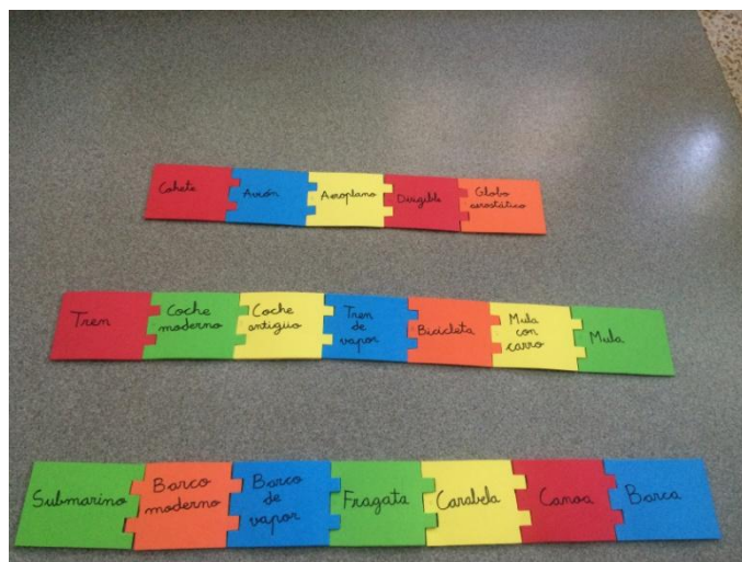
Puzzles sesión 6