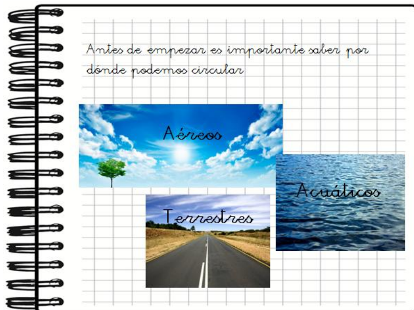
Ejemplo sesión 2