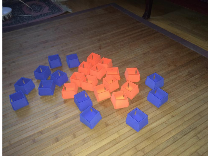
Cesta globo aerostático sesión 4