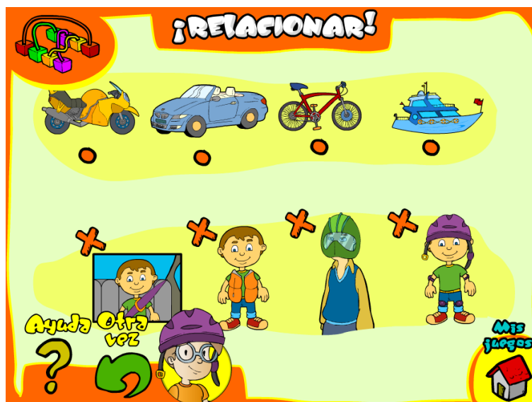
Ejemplo sesión 8