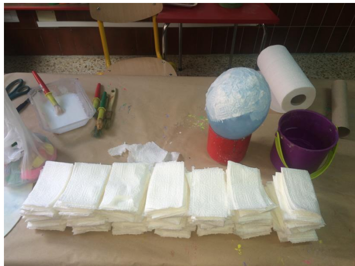
Elaboración globo aerostático sesión 4