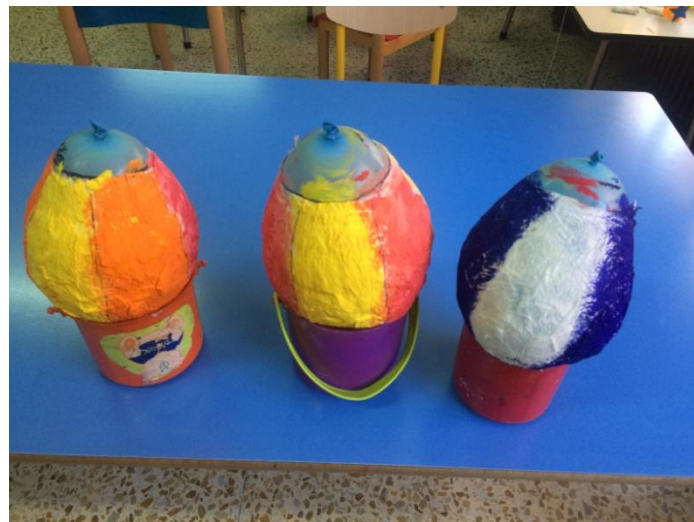
Elaboración globo aerostático sesión 4