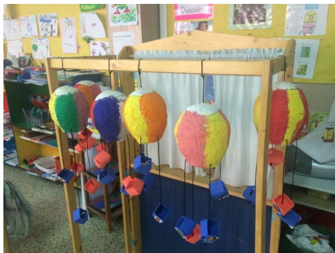
Elaboración globo aerostático sesión 4