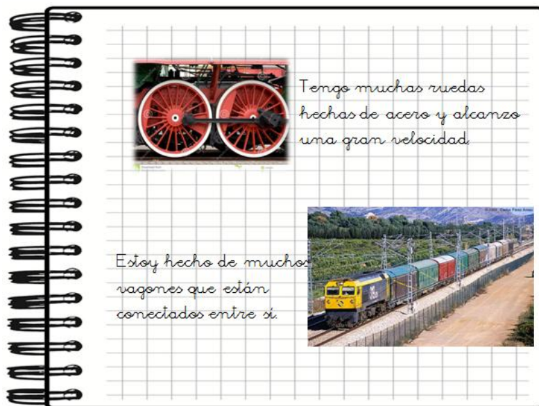
Ejemplo sesión 2