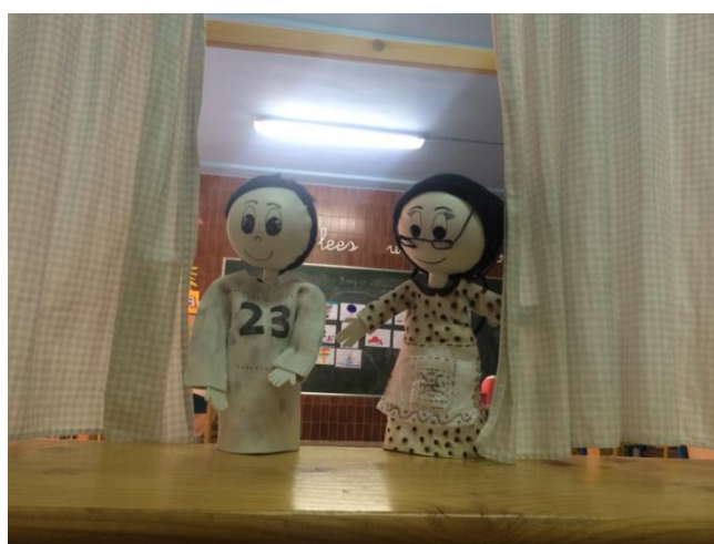
Marionetas cuento sesión 5