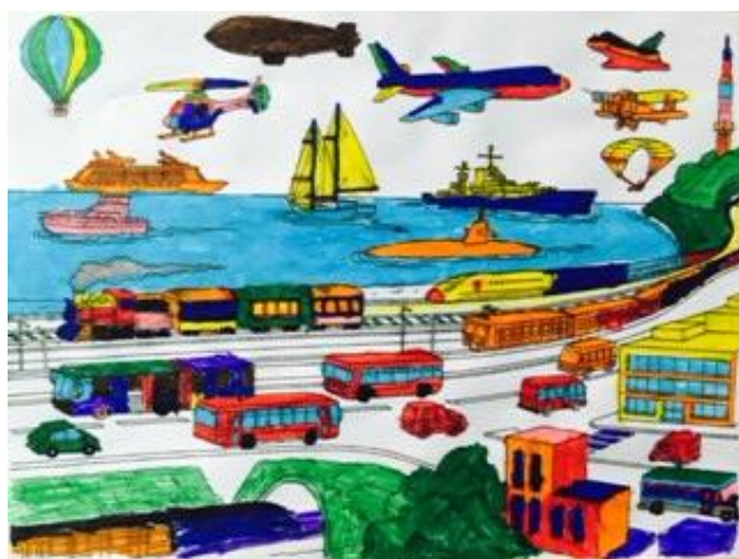
Pieza del cuento coloreada por los niños para la sesión 9