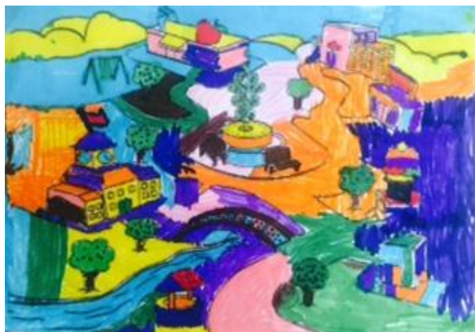
Pieza del cuento coloreada por los niños para la sesión 9