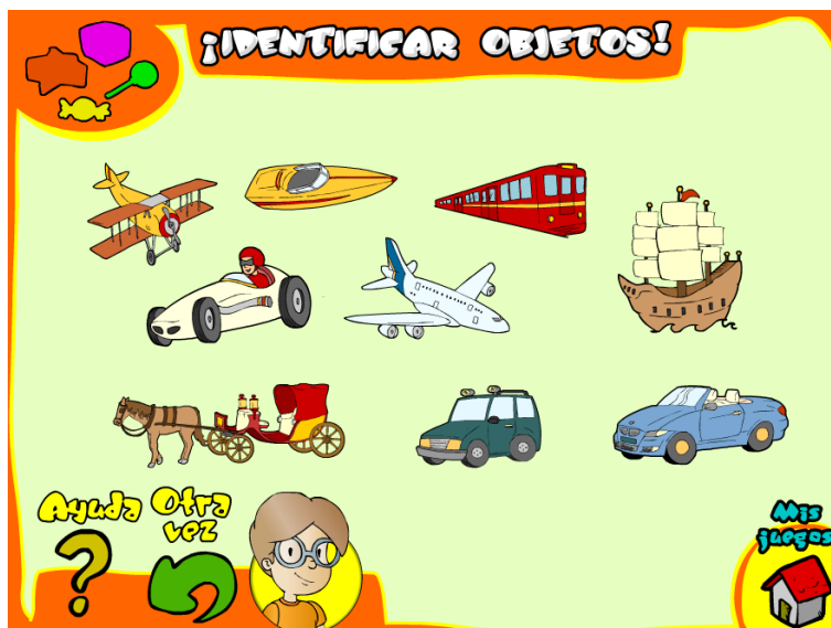
Ejemplo sesión 8