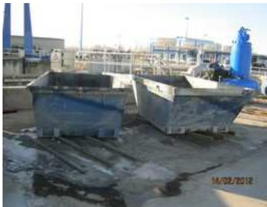
Figura 5. Zona de carga y descarga del pozo de entrada de la EDAR

- Zona de carga y descarga del pozo de entrada: Riesgo de golpes y magulladuras con la maquinaria. Se deberá señalar la zona de carga y descarga de los contenedores y se estipulará que sólo los trabajadores de la empresa externa están autorizados para manipular los contenedores.