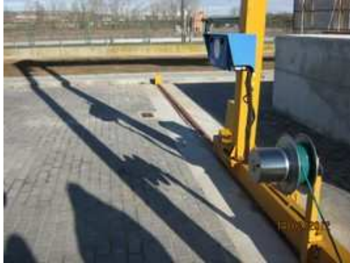
Figura 6. Bombeo del Carrascal

- Bombeo del Carrascal: Presenta riesgo de atrapamientos entre las partes móviles de los equipos. Aunque la máquina posee dispositivo de parada automática en caso de interacción hombre-máquina, se deberá señalizar la existencia de maquinaria en movimiento.