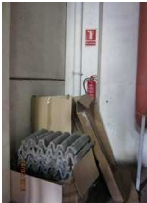
Figura 11. Extintor de incendios

- Extintores: Riesgo de incendio. Todos los extintores deberán estar en lugar visible y ser accesibles. Como se observa en la figura adjunta, el extintor del taller aparece oculto detrás de los productos almacenados, por lo que habría que liberar el acceso hacia él.