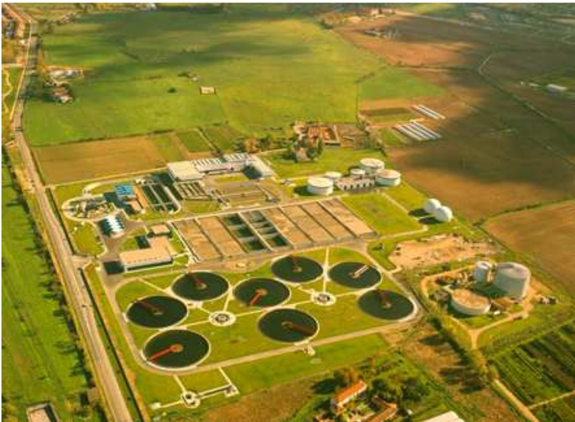
Figura 2. Vista aérea de la EDAR de Valladolid

Aguas de Valladolid se encargará de la gestión de la explotación de la EDAR de Valladolid hasta el 30 de junio de 2017, con el objetivo de mantener un alto rendimiento de la depuración de las aguas de la ciudad y una valorización de los residuos generados en el proceso.