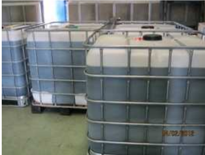
Figura 10. Contenedores de residuos

- Contenedores de almacenamiento de residuos: Riesgo de contacto con sustancias químicas. Estos contenedores deberían tener la ficha de seguridad del producto químico almacenado catalogado como residuo peligroso en lugar visible. Como puede observarse, estos contenedores no cuentan con ninguna ficha identificativa, por lo que habría que solicitársela al encargado de residuos de la planta.