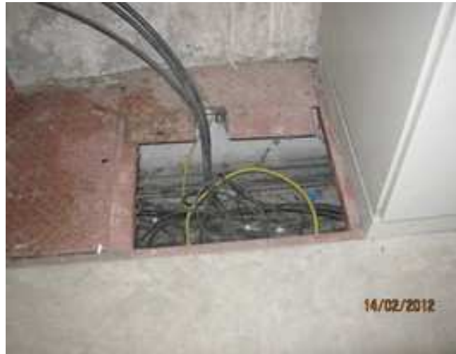
Figura 12. Instalación eléctrica

- Instalaciones eléctricas: Riesgo de contactos eléctricos e incendios. Proteger los fusibles y bornes en tensión del interior de cuadros eléctricos con pantalla de metacrilato o similar, y señalizar encima el riesgo eléctrico, y reparar aquellas protecciones rotas .