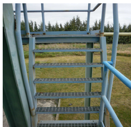
Figura 13 y 14. Escalera de subida al digestor y a la centrífuga