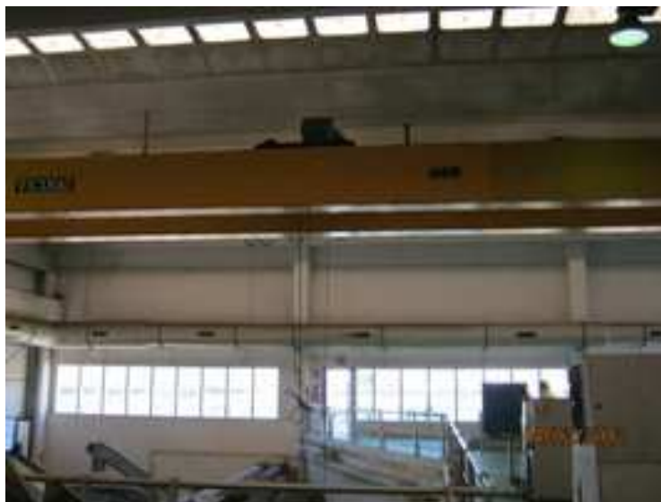
Figura 7. Puente grúa

- Puente grúa: Riesgo de caídas a distinto nivel. La subida al puente grúa para realizar trabajos de reparación del mismo o para efectuar el cambio del sistema de iluminación debe realizarse en condiciones seguras, con el uso de los EPI's necesarios y estando debidamente señalizado el riesgo existente.