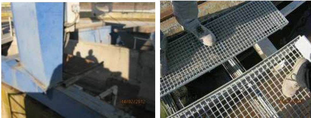
Figura 3 Y 4. Pozo de entrada de la EDAR

- Pozo de entrada de la EDAR: Presenta un riesgo de caídas al mismo y a distinto nivel por la existencia de huecos. Se deberá vallar la zona con barandillas que impidan el acceso y cubrir todos los huecos existentes mediante trámex o alguna otra estructura similar.