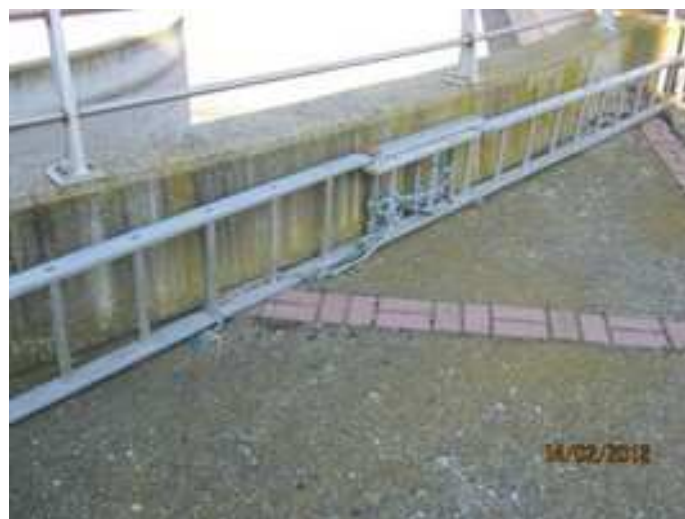
Figura 9. Escalera del tanque de tormentas

- Tanque de tormentas: Caída de personas a distinto nivel. Todas las escaleras en la planta deben cumplir con la NTP 239 relativa a escaleras manuales. En el caso de las escaleras metálicas que se observan en la figura adjunta, deben poseer algún sistema de sujeción o apoyo (zapatas, ganchos) y deben estar recubiertas de material inoxidable. Como puede observarse, la escalera del tanque de tormentas incumple estos dos requisitos. Asimismo, debe consultarse el Manual de Normas del Grupo Agbar antes de su utilización.