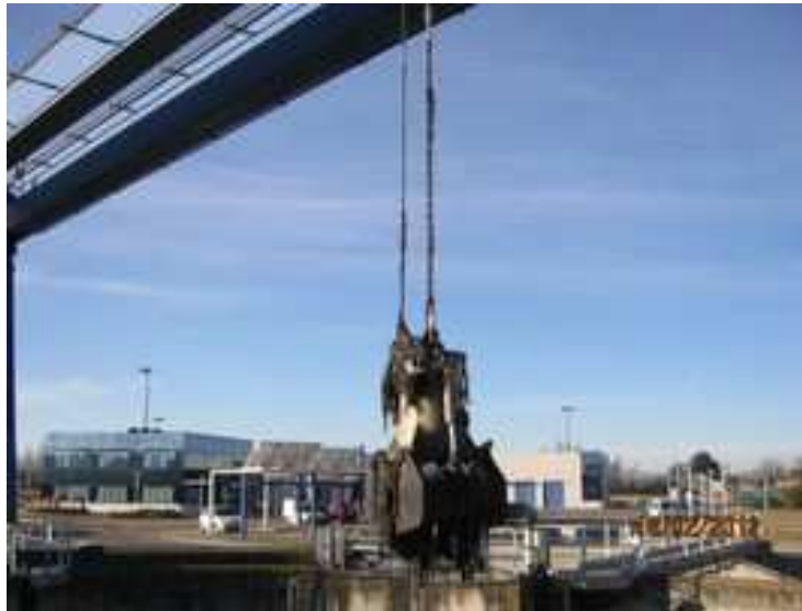
Figura 8. Cuchara bivalva

- Cuchara bivalva: Riesgo de caída de objetos por desplome. Cuando no se estén realizando labores de mantenimiento, la cuchara bivalva deberá permanecer apoyada en el suelo.