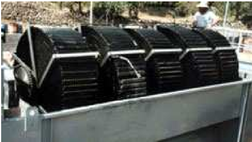
Figura 15. Sistema de depuración por biodiscos

Asimismo, en la realización del mantenimiento del sistema, para la colocación de los tornillos del interior de los biodiscos el operario tiene que situarse en la parte superior del mismo sin ningún tipo de protección, ya que no es posible su anclado a una grúa, con el consiguiente riesgo de caída.