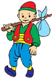
INTENTA COPIAR A KELOGLAN. FORMA UN PUZZLE CON KELOGLAN

También han decorado la silueta del personaje y han pegado letras móviles para formar su nombre.