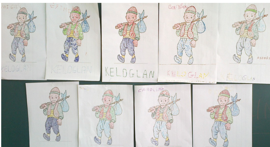
Dibujos elaborados por alumnos de 5 años, con pinturas y bolitas de papel de seda.