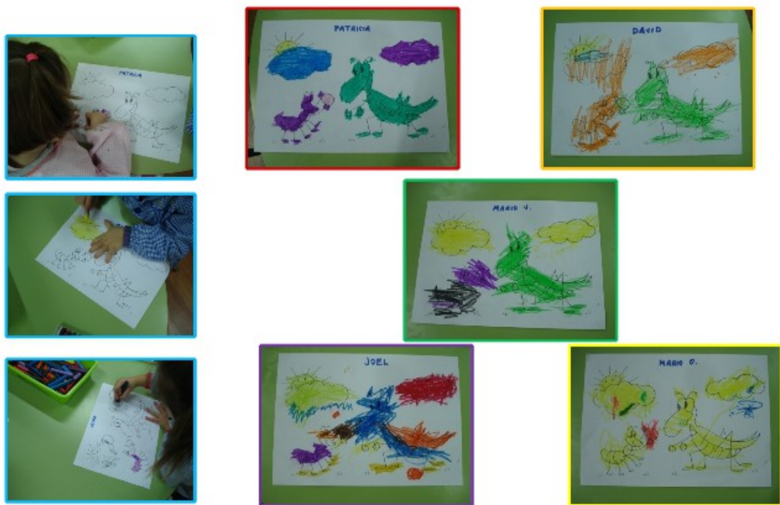
Dibujos coloreados por los alumnos de la clase de 3 años.

Otra actividad ha sido copiar el dibujo de uno de los personajes del cuento o la formación de puzzles, con imágenes que se les daban cortadas en piezas, dependiendo del nivel de los niños, 3, 4 o 5 años.