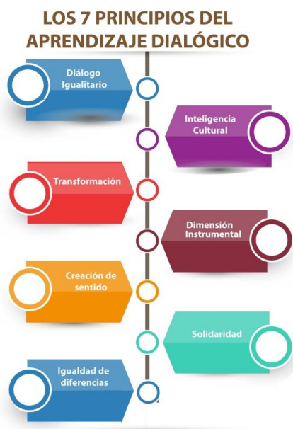
Figura 1: Los 7 principios del Aprendizaje Dialógico

inteligencia cultural, la igualdad de diferencias, la transformación, la solidaridad y la creación de sentido.