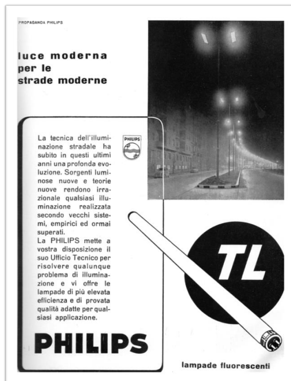
Fig. 1. Immagine pubblicitaria della ditta Philips.

Se si assume tale situazione come contesto economico, sociale e culturale in cui si verifica il terremoto che nel 1968 colpisce l'area del Belice, in Sicilia, non è difficile comprendere gli esiti di quella ricostruzione.