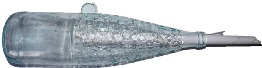
FOTO DE LA CARTA EN LA BOTELLA