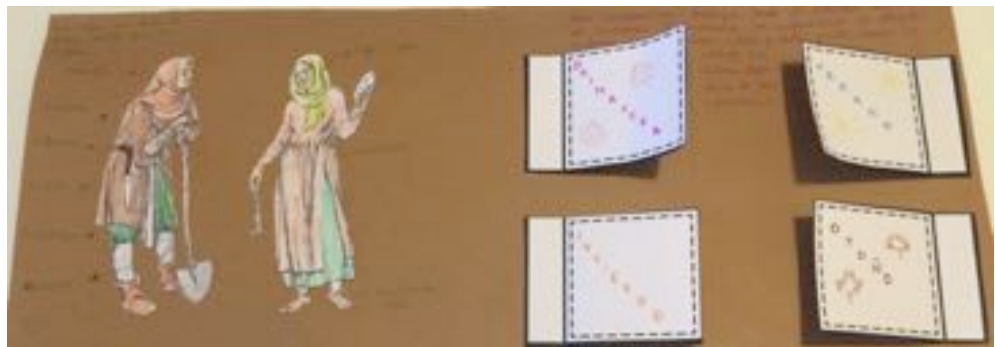
Las ropas y las labores de los vecinos dependiendo de las estaciones del año. Elaboración propia.