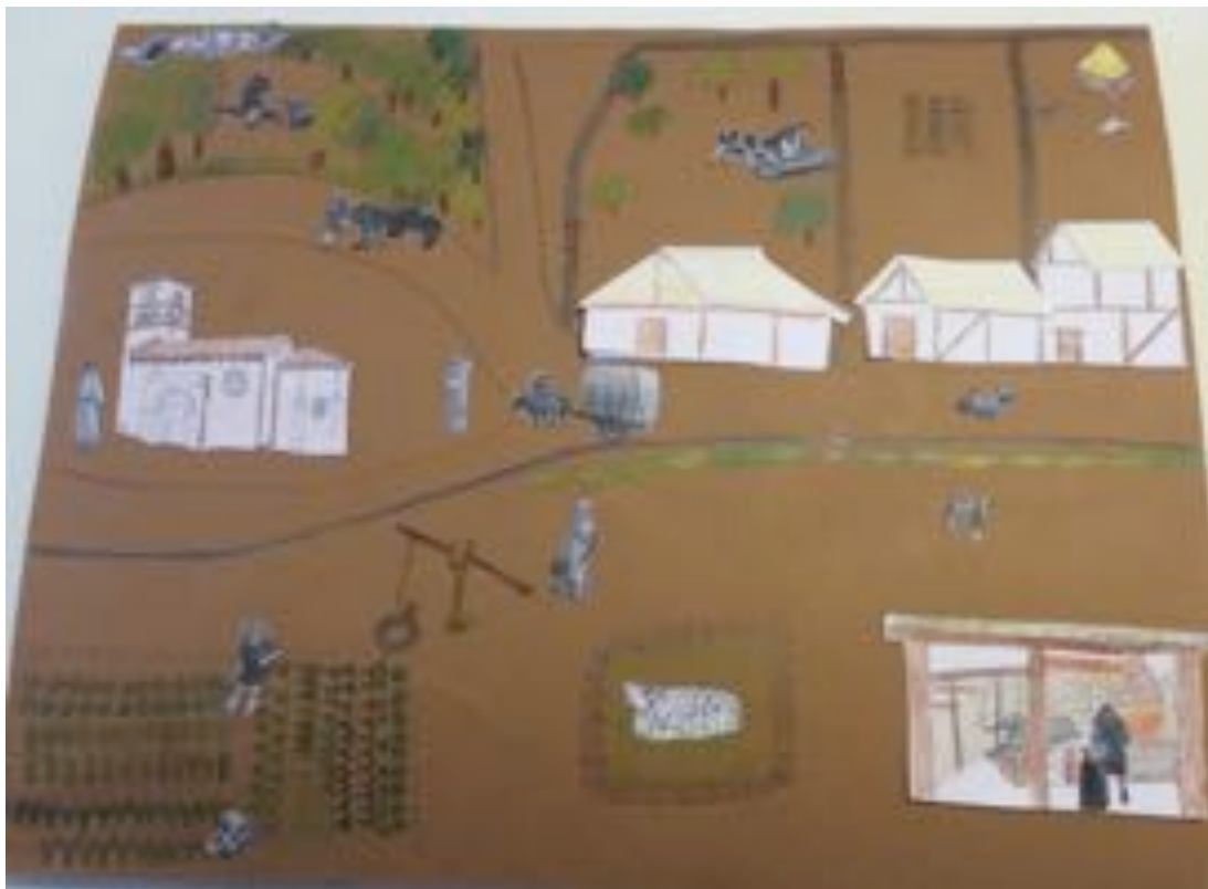
La distribución de la villa. Elaboración propia.