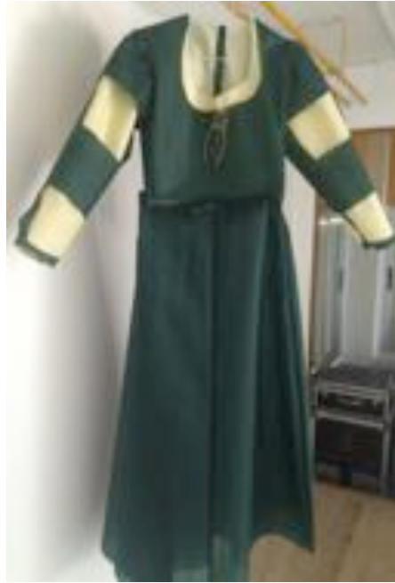
Vestido de las mujeres. Elaboración propia.