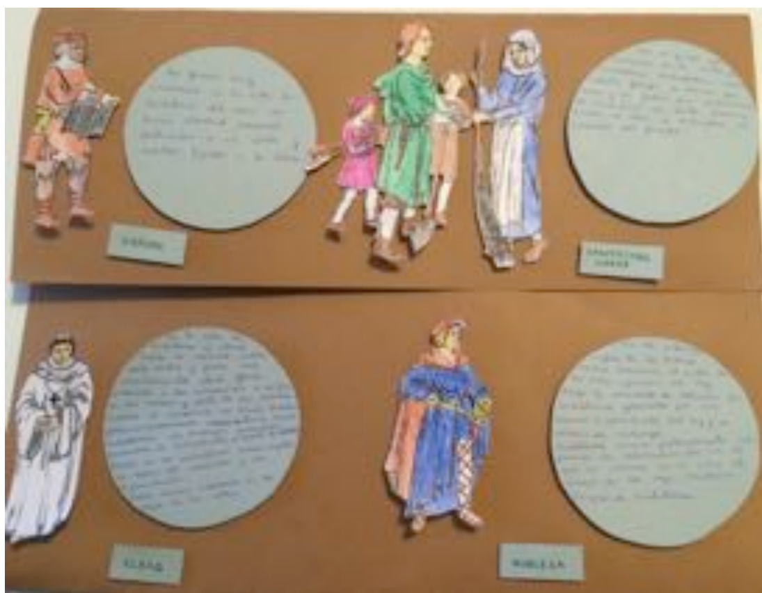
Los habitantes de la villa medieval de Santillana del Mar. Elaboración propia.