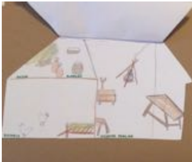
El interior de las viviendas. Elaboración propia.