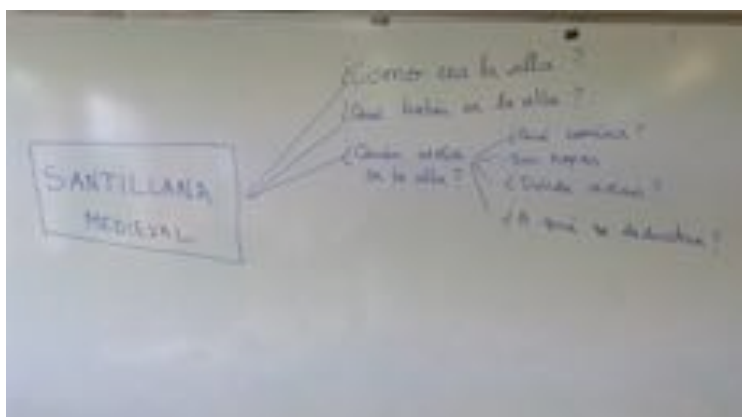
Esquema qué queremos saber. Elaboración propia.