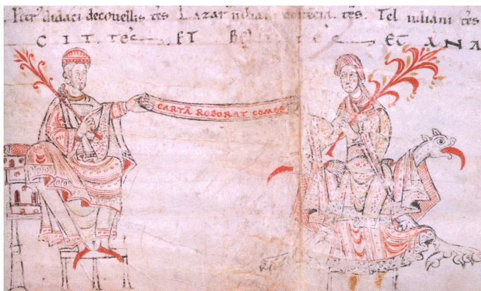
Detalle de la miniatura carta de arras del conde Rodrigo a su esposa Urraca Fernández

Luego la infanta doña Sancha dispuso el tálamo en los palacios reales y se sucedieron en los alrededores músicas, cantos y bailes. Alfonso y García sentados en el trono sobre una tarima elevada a las puertas del palacio, en compañía de “obispos, abades, condes, nobles y duques”. Los clérigos son, junto a los otros, meros espectadores de una fiesta que poco tiene de piadosa: carreras de caballos, alanceamiento de toros embravecidos y otros espectáculos, algunos de especial crueldad, como el de los ciegos que “intentando matar a un puerco que se había dispuesto para ellos, se herían entre sí provocando a la risa a todos los presentes”. Nada se dice en la crónica de actos litúrgicos y celebraciones religiosas. El matrimonio era un asunto de los laicos sobre el que los eclesiásticos no habían impuesto aún el estricto control que más tarde habrían de ejercer.