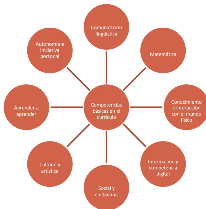
Figura 1. Competencias básicas en el currículum recogidas en la Ley Orgánica de Educación de 2006

Algunos ejemplos para el trabajo de estas competencias mediante las Actividades en el medio natural son los siguientes: