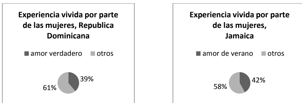
Figura 1.

Comparando estos destinos podemos ver las pequeñas diferencias que existen entre ambos, sin embargo, se puede ver como los porcentajes cambian desde la primera vez que visitan estos países a cuando ya lo han hecho en reiteradas ocasiones y los sentimientos que producen los hombres en estas turistas sexuales.