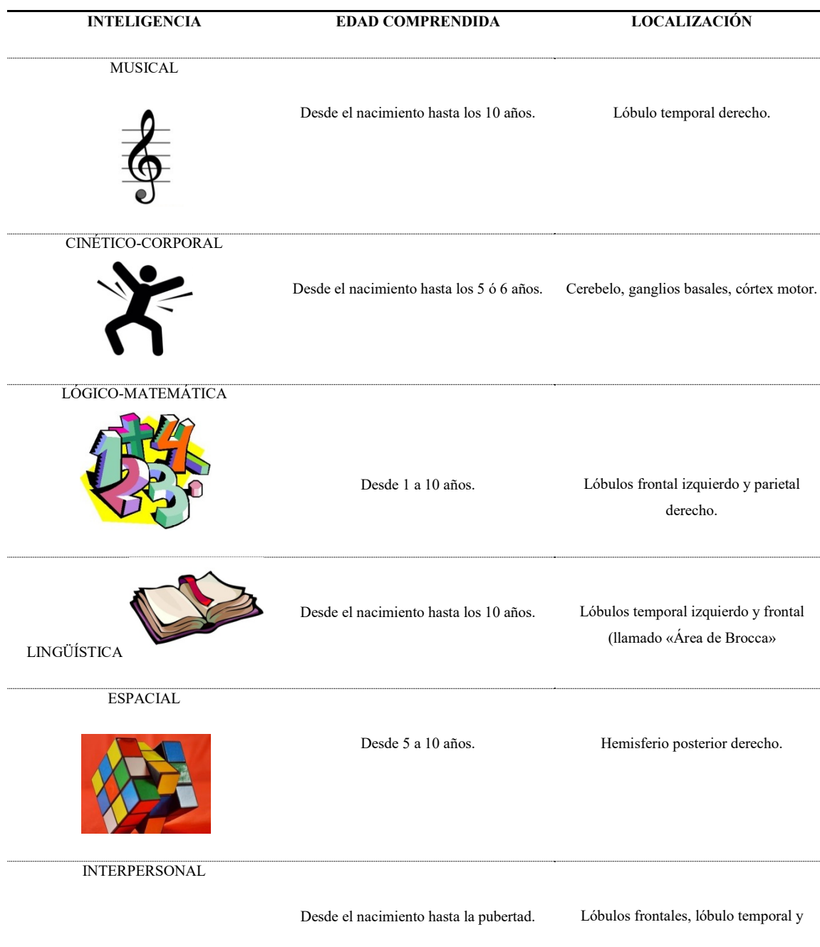
Tabla 1: Edad comprendida y localización de las Inteligencias Múltiples

A continuación presentamos una tabla-resumen en la que se muestra cada una de las inteligencias analizadas en los apartados precedentes, remarcando tanto la edad en las que dichas inteligencias se desarrollan en el ser humano y cuándo es más importante trabajarlas de manera directa, como la zona en la que se encuentran situadas en el cerebro.