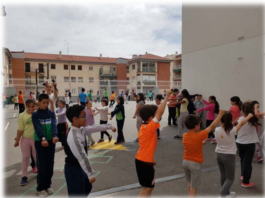
Imagen 2. Sesión de canciones y juegos acumulativos

La primera sesión fue un poco difícil, ya que la mayoría de los niños y las niñas observaban y solo participaban en las actividades un número muy reducido de alumnos. Según iban pasando los días se iban animando más niños a participar en las sesiones.