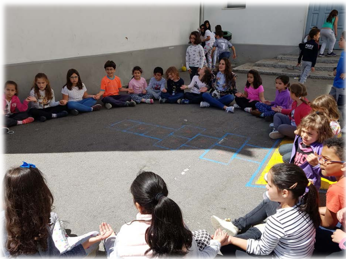
Imagen 5. Sesión de palmas

bastante sobre este tema y creo que fue por el número de alumnos, o tal vez porque en el grupo integrado por 20 participantes, todos los niños estaban en algún curso comprendido entre primero y tercero de Primaria, a los cuales va dirigida esta propuesta de intervención educativa.