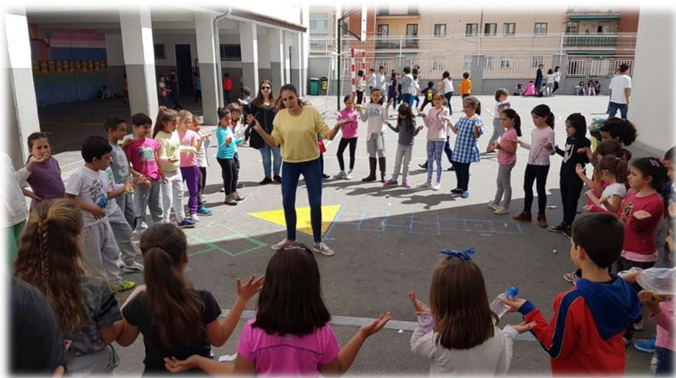
Imagen 3. Sesión de juegos y canciones de animales

El primer día casi ningún niño participaba, pero a partir del segundo día se unieron bastantes. He de decir, que la mayoría de los participantes a las sesiones eran niñas. La media de niños y niñas por sesión era de unos 30 participantes, aunque he llegado a tener 70 en sesiones como la del paracaídas. En la mayoría de las sesiones las edades de los alumnos estaban comprendidas entre 6 y 10 años. Había niños y niñas de diferentes etnias y culturas.