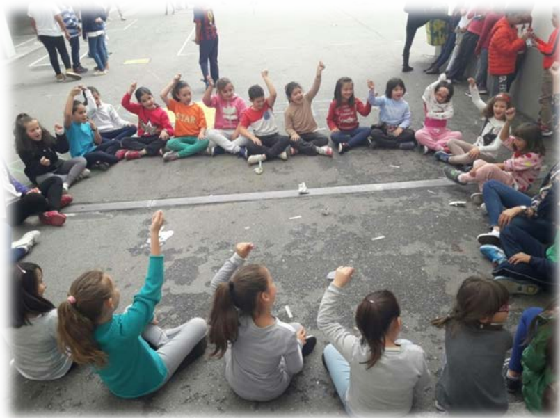
Imagen 7. Sesión de percusión corporal

He llegado a la conclusión de que, en función del tipo de alumnado que tengas, pueden funcionar unos juegos u otros y por eso hay que tener siempre recursos para poder cambiar de actividad sobre la marcha y saber hacer una buena sesión en la que los niños y las niñas disfruten.