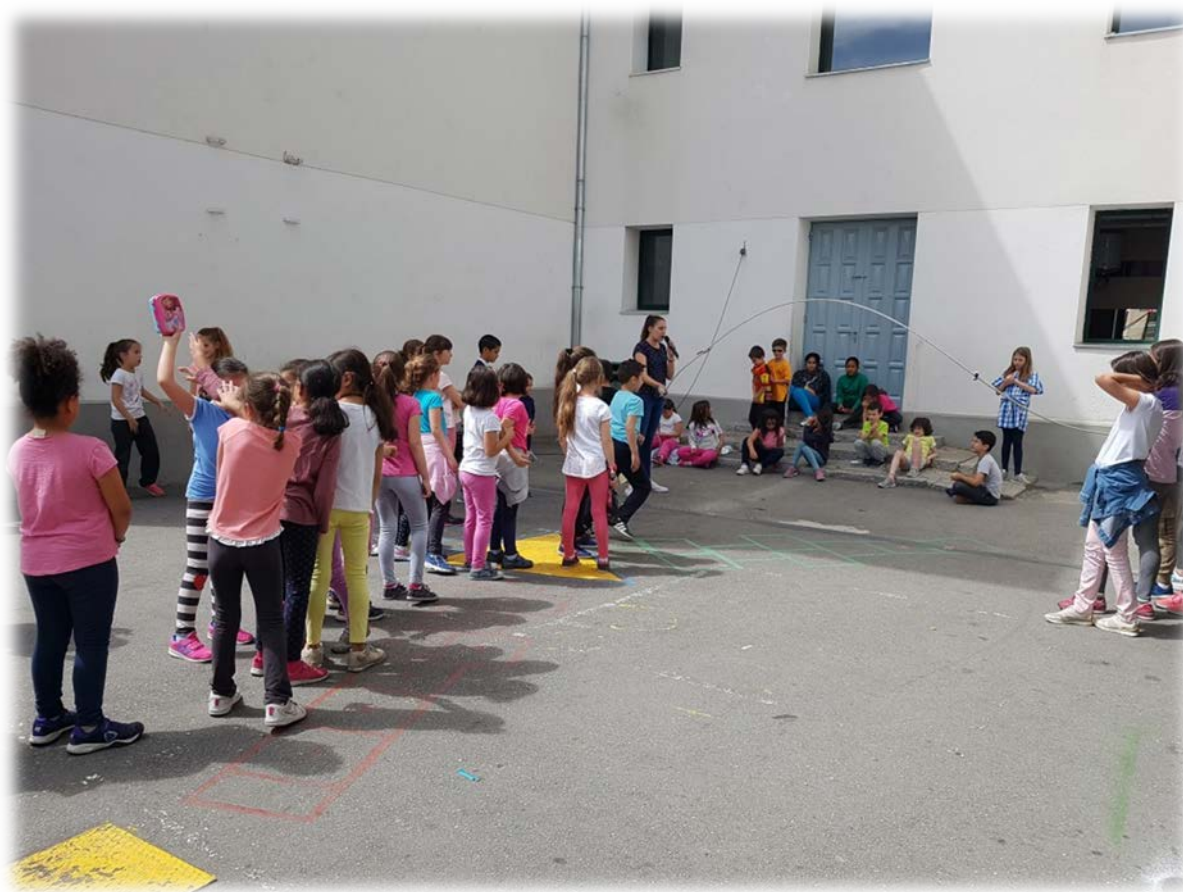
Imagen 4. Sesión de comba

Sin embargo, este año he comprobado que es todo lo contrario. El alumno estaba deseando jugar con más niños pero no sabía cómo introducirse a un grupo para poder jugar con ellos. Ha acudido a todas las sesiones y se ha integrado con todos los demás niños.