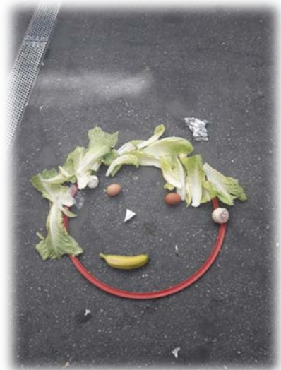
Imagen 6. Sesión de alimentos

Para mí ha sido una gran experiencia. Creo que he enseñado y he aprendido de los niños distintas canciones y juegos relacionados con la música. Juntos hemos disfrutado en todos los recreos. Espero que, con esto, los alumnos sepan a qué jugar en el patio y socialicen unos con otros. Que los niños y las niñas que estaban un poco perdidos y no jugaban con nadie se hayan integrado y puedan seguir divirtiéndose con los demás como lo han hecho estos días.