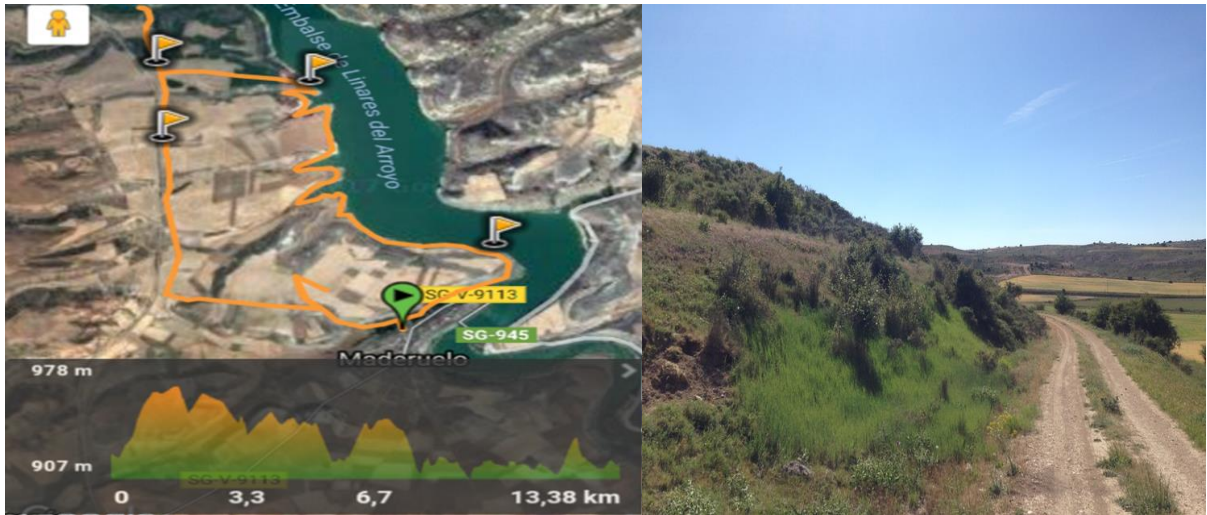
Anexo3: Actividad ciclomontañismo: Ruta Pantano de Linares