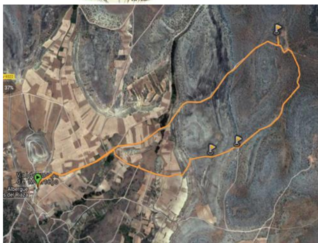
Anexo 1: Recorrido actividad senderismo: Senda de las Tenadas de Valdevacas