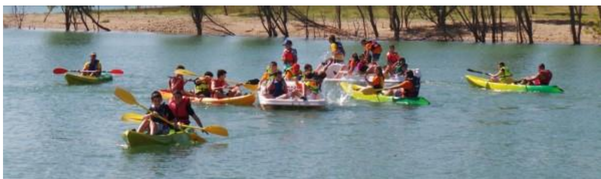
Anexo 2: Actividad de piragüismo: Pantano de Linares (Segovia)