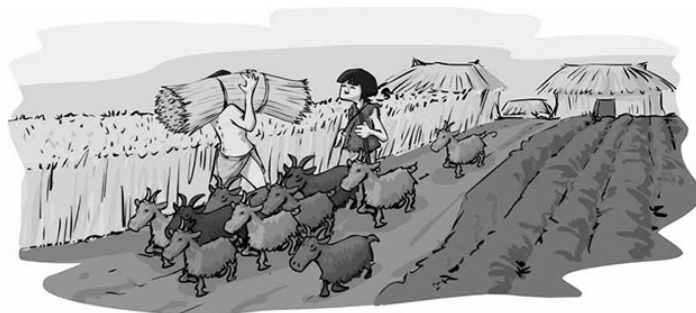
Figura 1: El hombre sedentario. Fuente: mdelossantos0.blogspot.(2014)

Recursos: Imagen del hombre sedentario, Folios, Bolígrafos o lápices