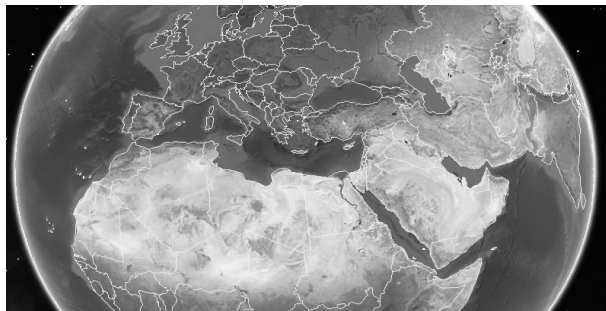
Figura 3:

Utilizaremos la pizarra digital para proyectar una imagen tomada de Google Earth. De este modo los alumnos que salgan a la pizarra colorearán los territorios que formaban parte del Imperio Romano. Primero, deben localizar Roma.