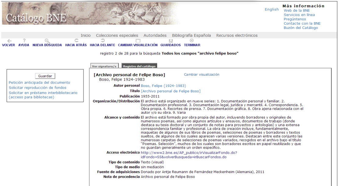
Fig. 8. Descripción del Archivo personal de Felipe Boso en el Catálogo General de la BNE con su enlace a la Base de datos de Archivos Personales .