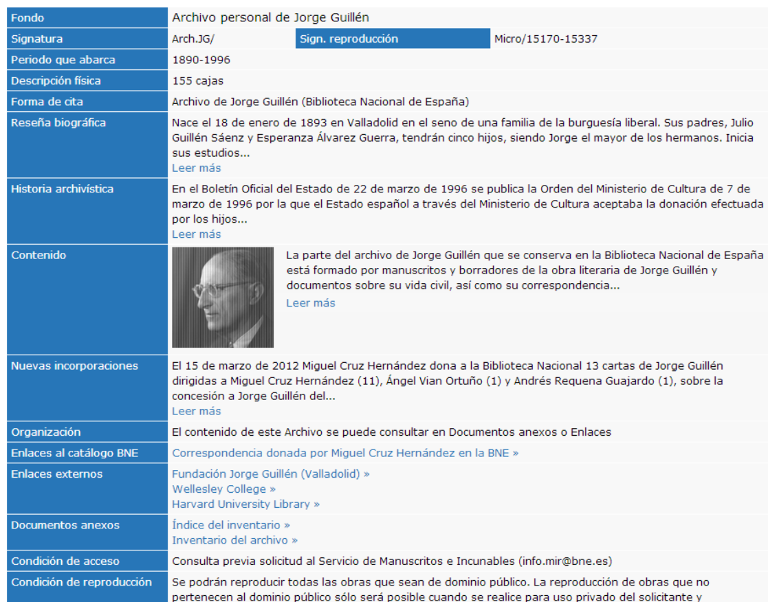
Fig. 10. Enlaces externos en la descripción del archivo de Jorge Guillén, que permiten reunir todos los documentos dispersos en varias instituciones.

La BNE confía en que aquellas instituciones que conservan documentos pertenecientes a archivos personales de los que la BNE custodia ya una parte, los describan y difundan vía web para aprovechar la posibilidad que ofrece la Base de datos de Archivos personales y de Entidades de incorporar los enlaces externos para ofrecer al investigador