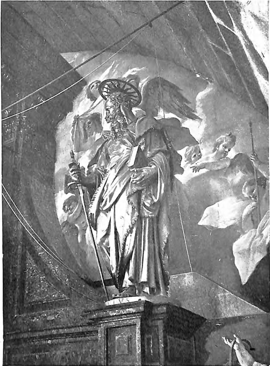
Lám. IV.—San Lorenzo el Real del Escorial. Retablo Mayor.—San Pablo (Pompeyo Leoni). (Foto Mas).