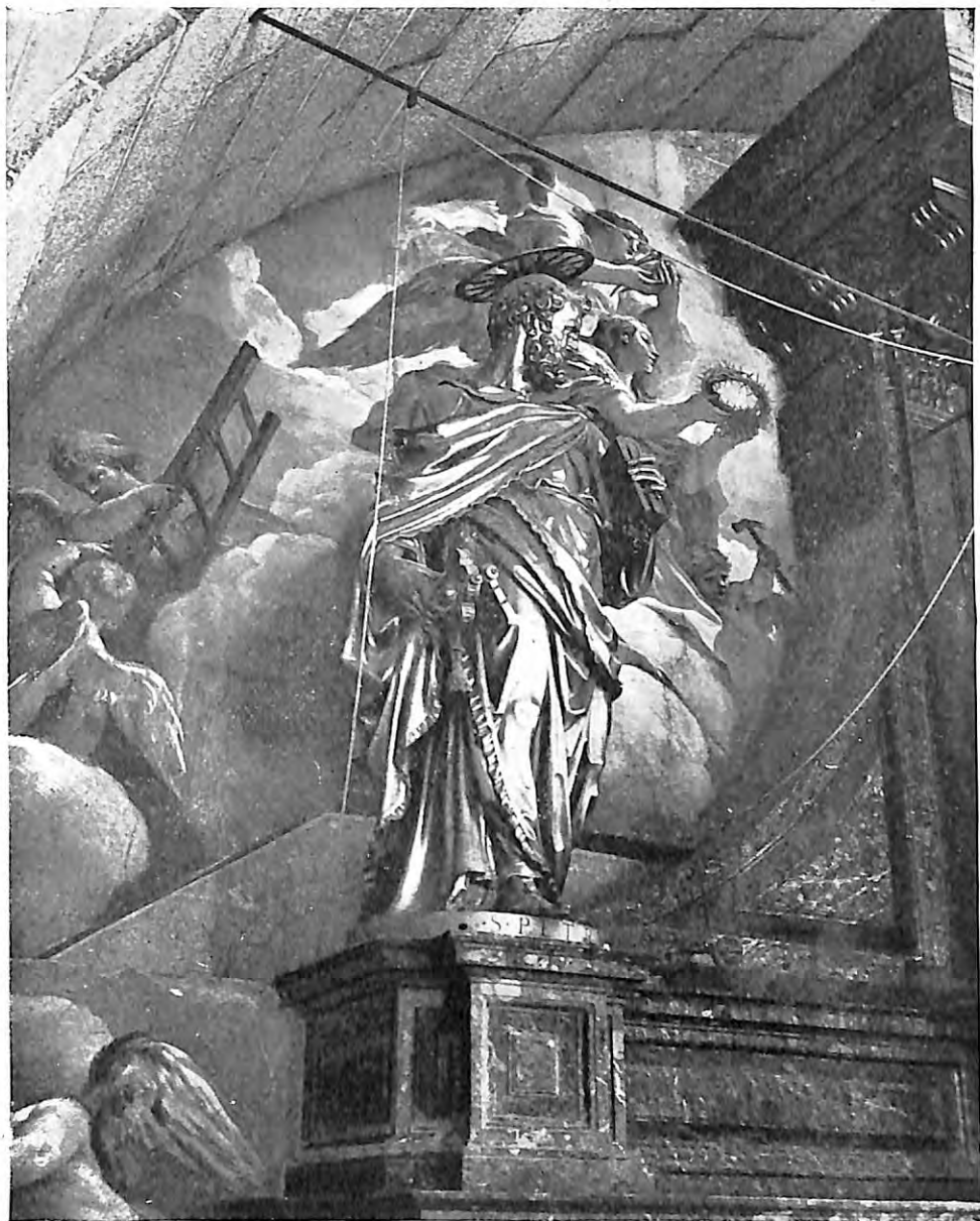
Lám. III.—San Lorenzo el Real del Escorial. Retablo Mayor.—San Pedro (Pompeyo Leoni). (Foto Mas).