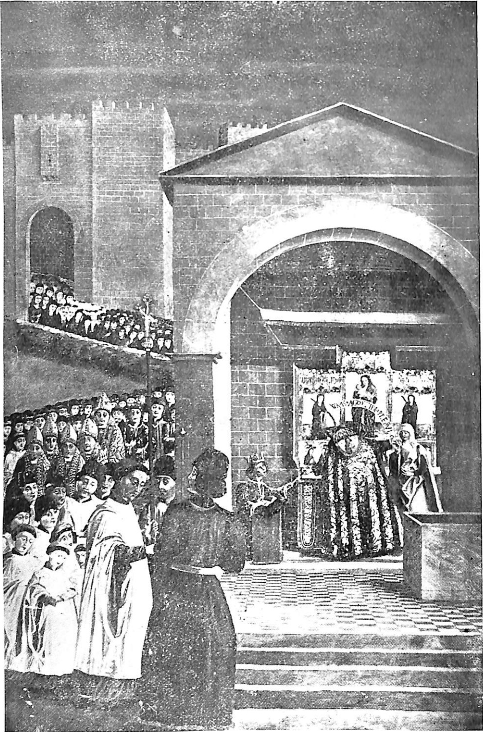
LÁMINA IV. La procesión y el milagro de Santa Leocadia.