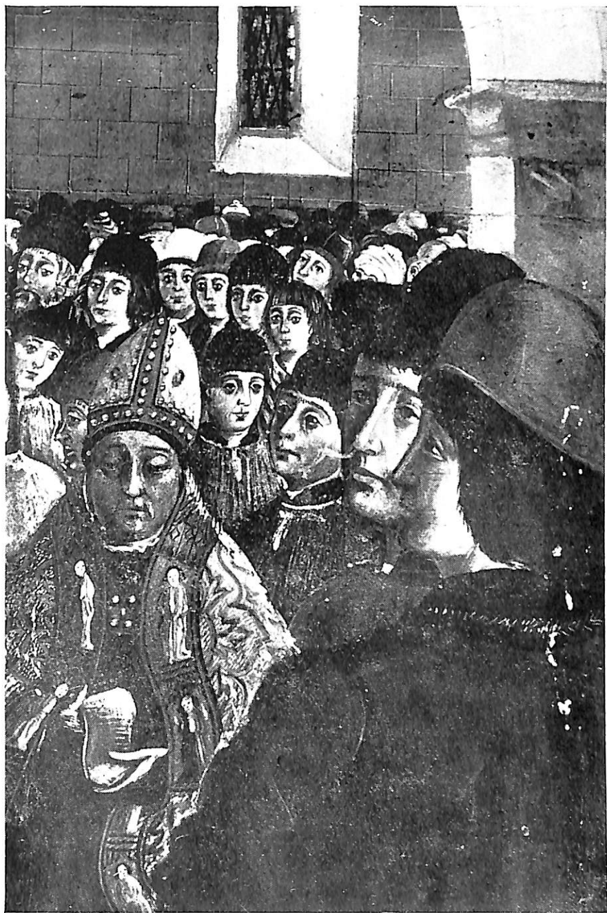
LÁMINA III. ¿El donante y el pintor? Pormenor de la tabla reproducida en la lámina I.