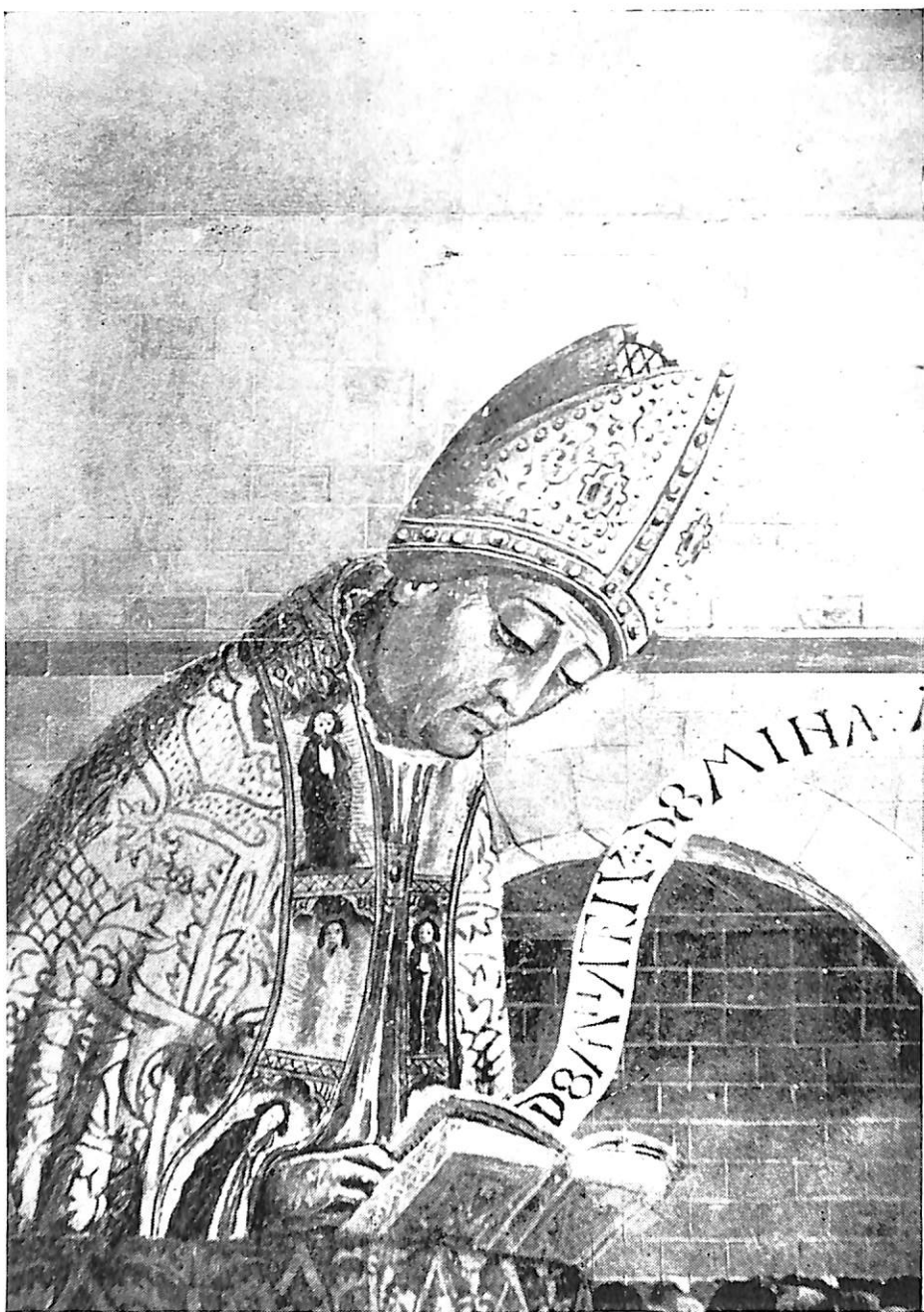
LÁMINA II. San Ildefonso. Pormenor de la tabla reproducida en la lámina I.