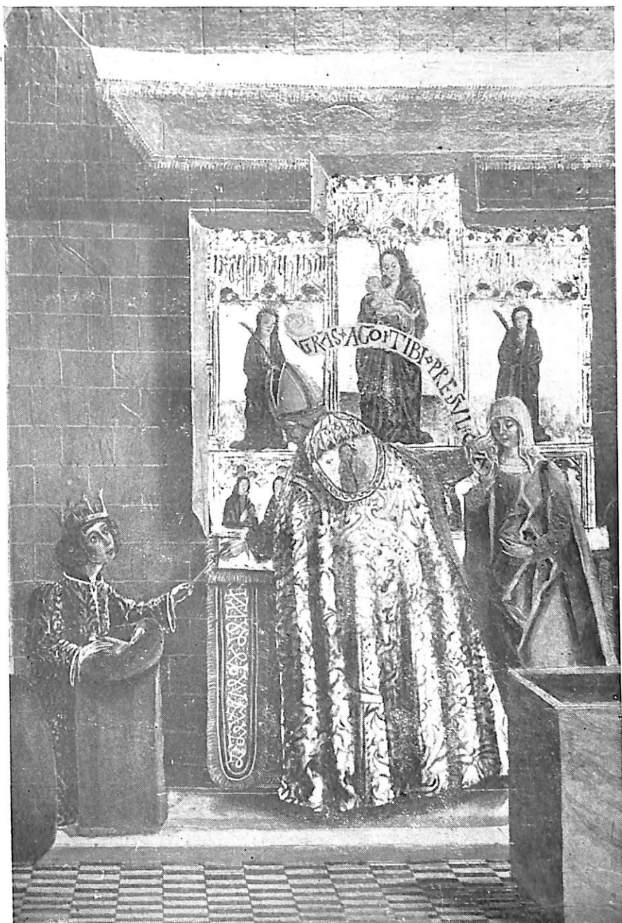
LAMINA V. El milagro de Santa Leocadia. Pormenor de la tabla reproducida en la lámina IV.