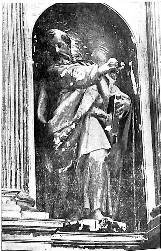
Velilla (Valladolid). Iglesia parroquial. Retablo Mayor, por Pedro de la Cuadra.