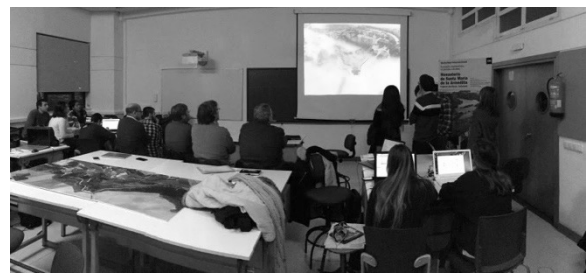
Figura 1. Cartel anunciador del Workshop Internacional El proyecto arquitectónico en paisajes culturales: Monasterio de Santa María de la Armedilla. Universidad de Valladolid. Enero de 2018. Fotografías del desarrollo del workshop y de las visitas. Dic. 2017 - Enero 2018.

Tema: El tema de trabajo elegido ha sido la recuperación y reutilización de un conjunto monacal construido en el S.XIV por los monjes jerónimos sobre los restos de una ermita semi-rupestre, completado en el S.XVI por los marqueses de Cuellar y los duques de Alburquerque, con un palacete y una nueva iglesia, con una de las primeras portadas renacentistas de Castilla. Los restos del monasterio, propiedad del Ayuntamiento de Cogeces del Monte, constituyen un excelente patrimonio arquitectónico y un notable ejemplo de construcción aterrazada e integrada en la ladera del arroyo de Valdecascón, afluente del Duero, conservando aún la finca original que alberga los terrenos dedicados a su actividad productiva, prados, bosques, huertos y una represa con molino junto al río, todos ellos comprendidos dentro de su cerca característica. El conjunto arquitectónico y el entorno del monasterio conforman un característico paisaje fluvial erosionado y deprimido sobre el páramo superior, que constituye un punto de parada y observación privilegiado para explicar el paso del tiempo y el paisaje de la comarca, y por lo tanto un patrimonio que debe ser conservado y puesto en valor.