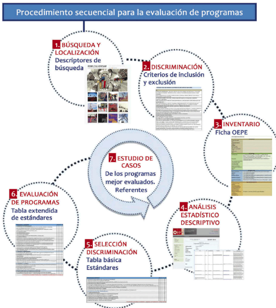
Ilustración 3. Procedimiento secuencial de selección de programas.