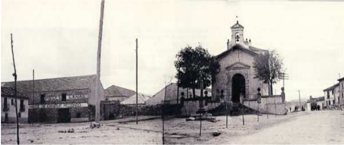
Fig.8 Plaza del Cristo del Mercado con el Mayo