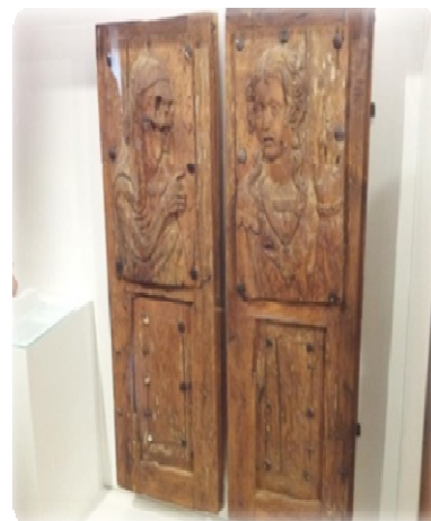
Fig.7 Ventana con relieves de la leyenda "Entre la Vida y la Muerte"