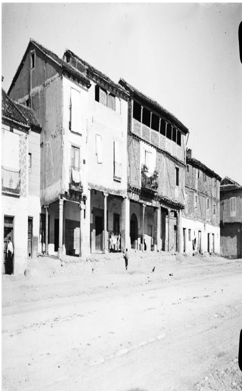
Fig.3 Casas porticadas Calle del Mercado Finales del siglo XIX