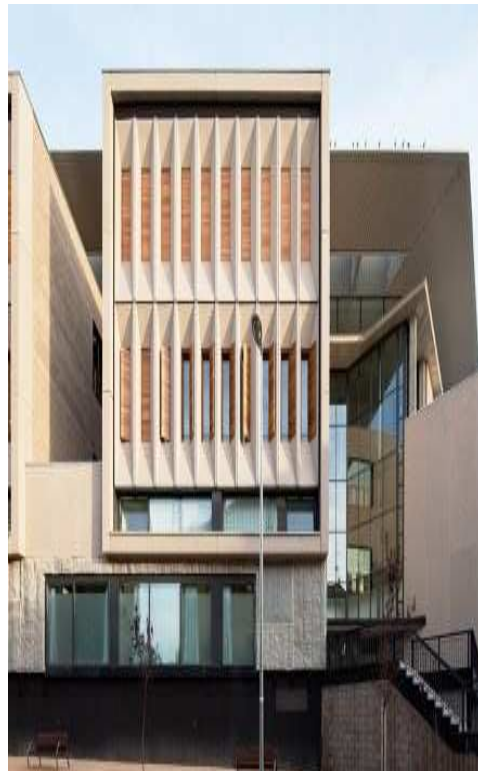
Fig.4 Primera fase del Campus de Segovia "María Zambrano" UVA