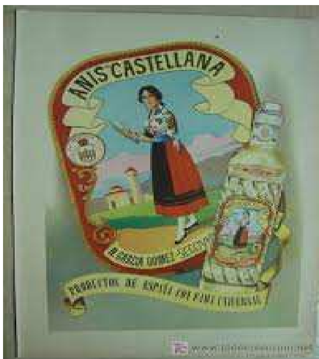
Fig.10 Detalle de la botella de anís “La Castellana”