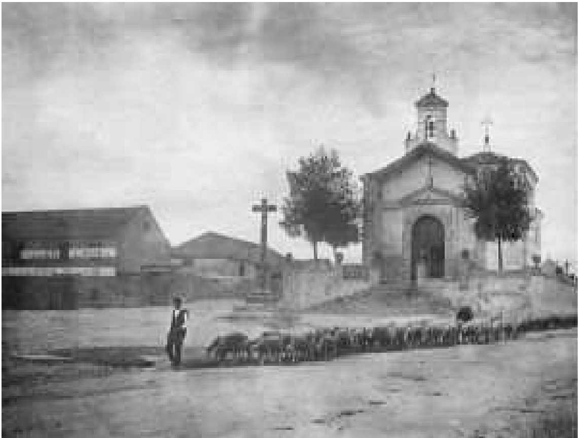
Fig. 2. Paso de rebaño por delante de la Ermita del Cristo del Mercado