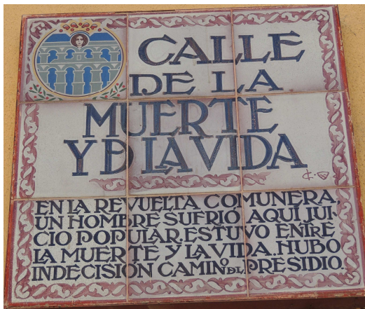
Fig.6 Placa de la Calle de la Muerte y de la Vida