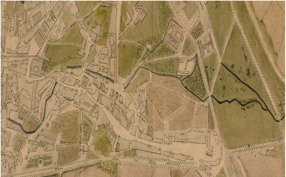
Fig.1. El Arrabal Grande del Mercado.

Fragmento del mapa de Odriozola de la ciudad de Segovia de 1901