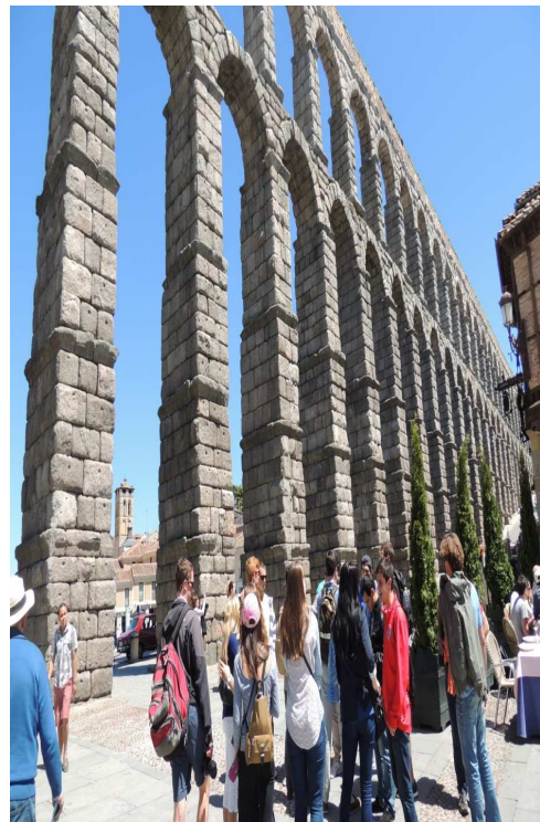
Fig.12 Plaza del Azoguejo con turistas Presente y futuro económico de Segovia