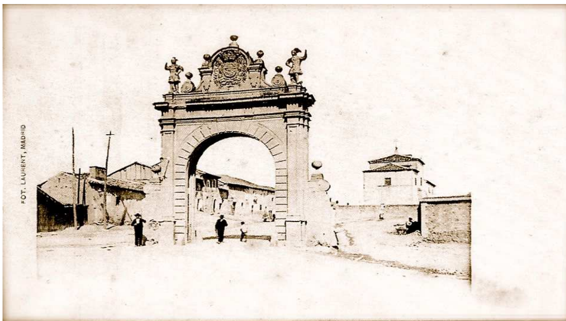
Fig 9 Arco de madrid