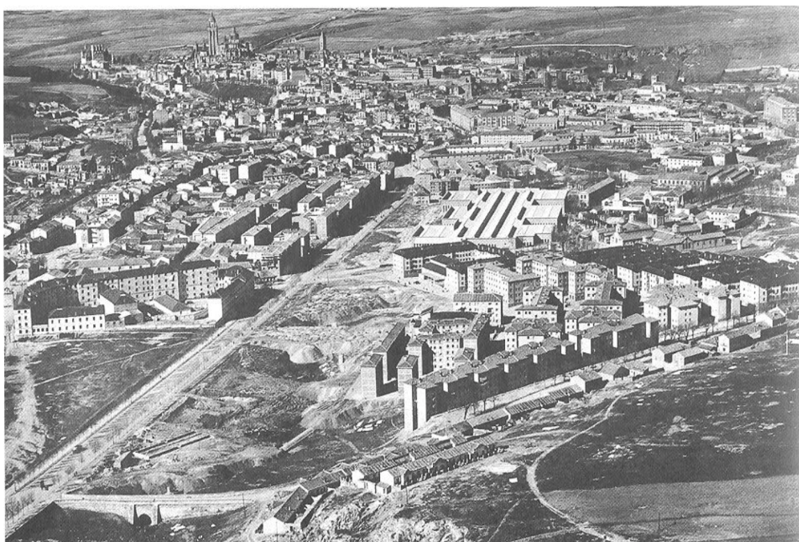
Fig.5 Vista del parque de la Dehesa desde el puente de Valdevilla