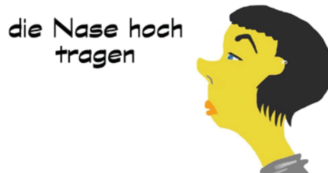
Fig. 4: Ejemplo de portada

Se hace una presentación con los resultados de la investigación que debe incluir como portada un dibujo que represente el dicho.