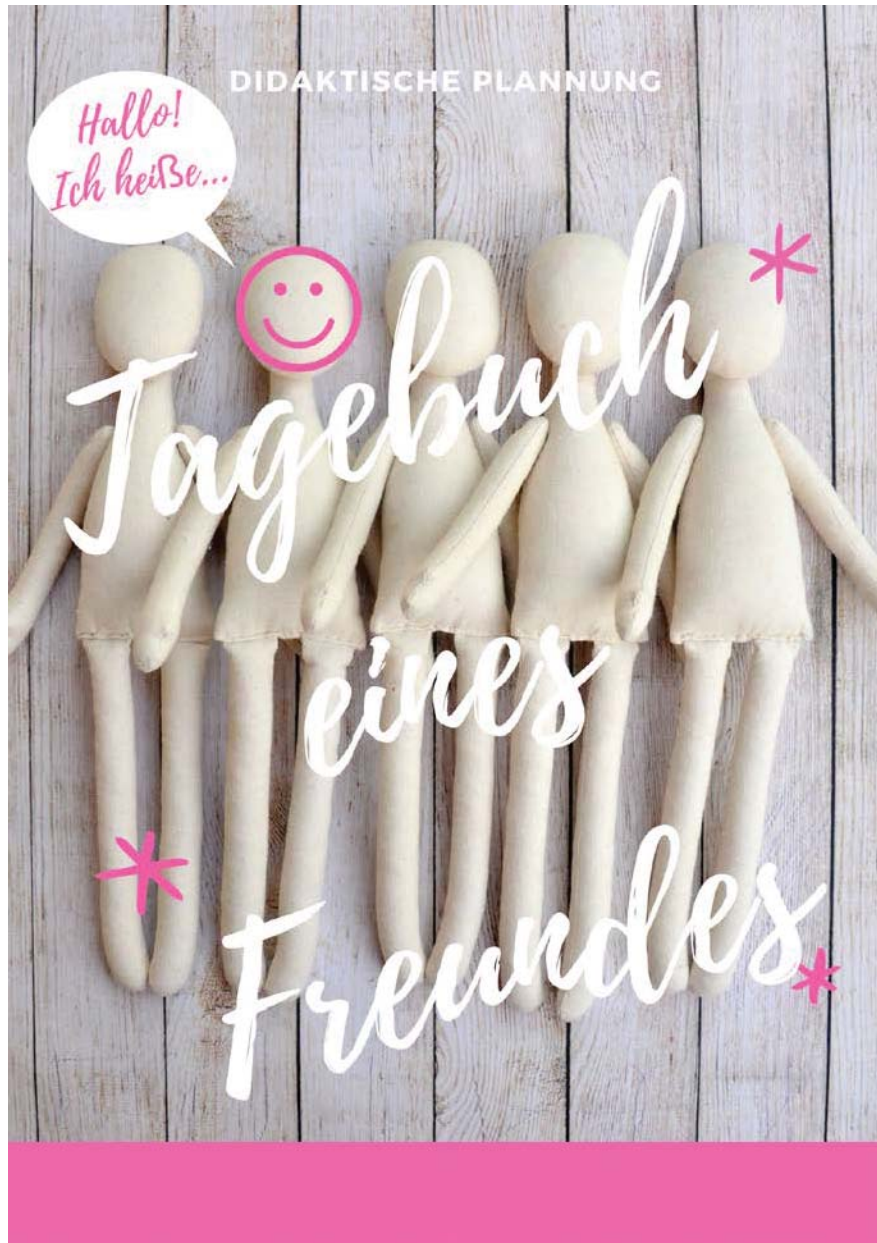
Fig. 2: Portada del proyecto. Elaboración propia, imagen de fondo recuperada de https://ar.pinterest.com/pin/485966616031834507/