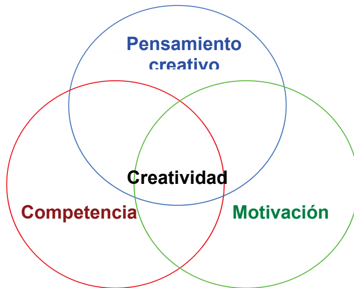
Fig. 1: Componentes de la creatividad (elaboración propia basada en lo dicho en Amabile 2012.)

A continuación desarrollaremos estos componentes con el fin de alcanzar una mejor comprensión de su funcionamiento en lo relativo a la creatividad para, de este modo, poder plantear pautas pedagógicas que sirvan como guía para elaborar una metodología más concreta dirigida al desarrollo de actividades de escritura creativa.