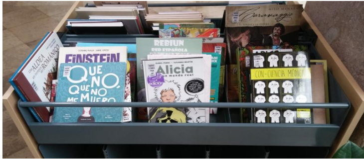
Imagen 5: Cajón de cómics de la Biblioteca Universitaria Reina Sofía, en la que se han incorporado en el último año un gran número de títulos que son Medicina Gráfica. En la imagen, “Que no que no me muero”, “Alicia en un mundo real”, “Conciencia Médica”. Elaboración propia.