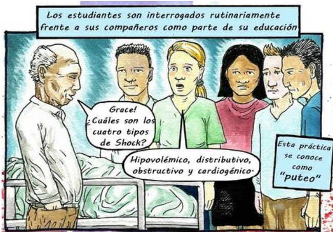
Imagen 6. Viñeta de “Healing alone”, de Isabel Hanson y Safdar Ahmed. Traducido al español por José Manuel Velasco y Gabi Heras para proyecto HU-CI.