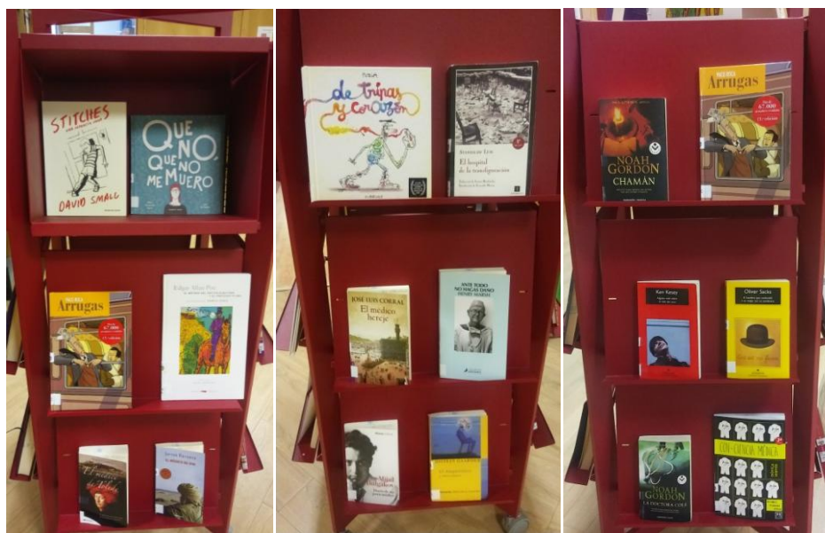
Imágenes 2, 3, 4. Estantes de la Biblioteca de la Facultad de Ciencias de la Salud, en los que se han incorporado algunas patografías gráficas como (de izq. a dcha.): “Stitches”, “Que no que no me muero”, “Arrugas”, “De tripas corazón”, “Con-ciencia médica”.