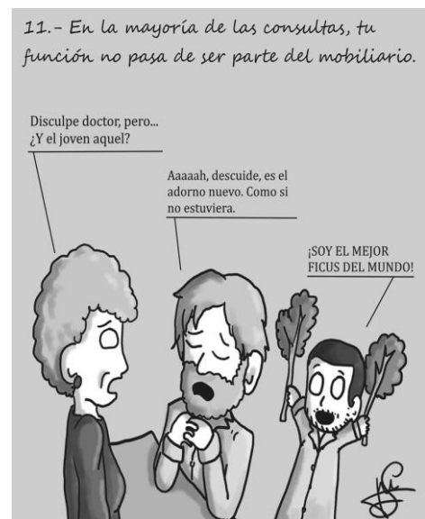
Imagen 7. Reproducida con autorización de Javier Sánchez, autor de Reglas Médicas