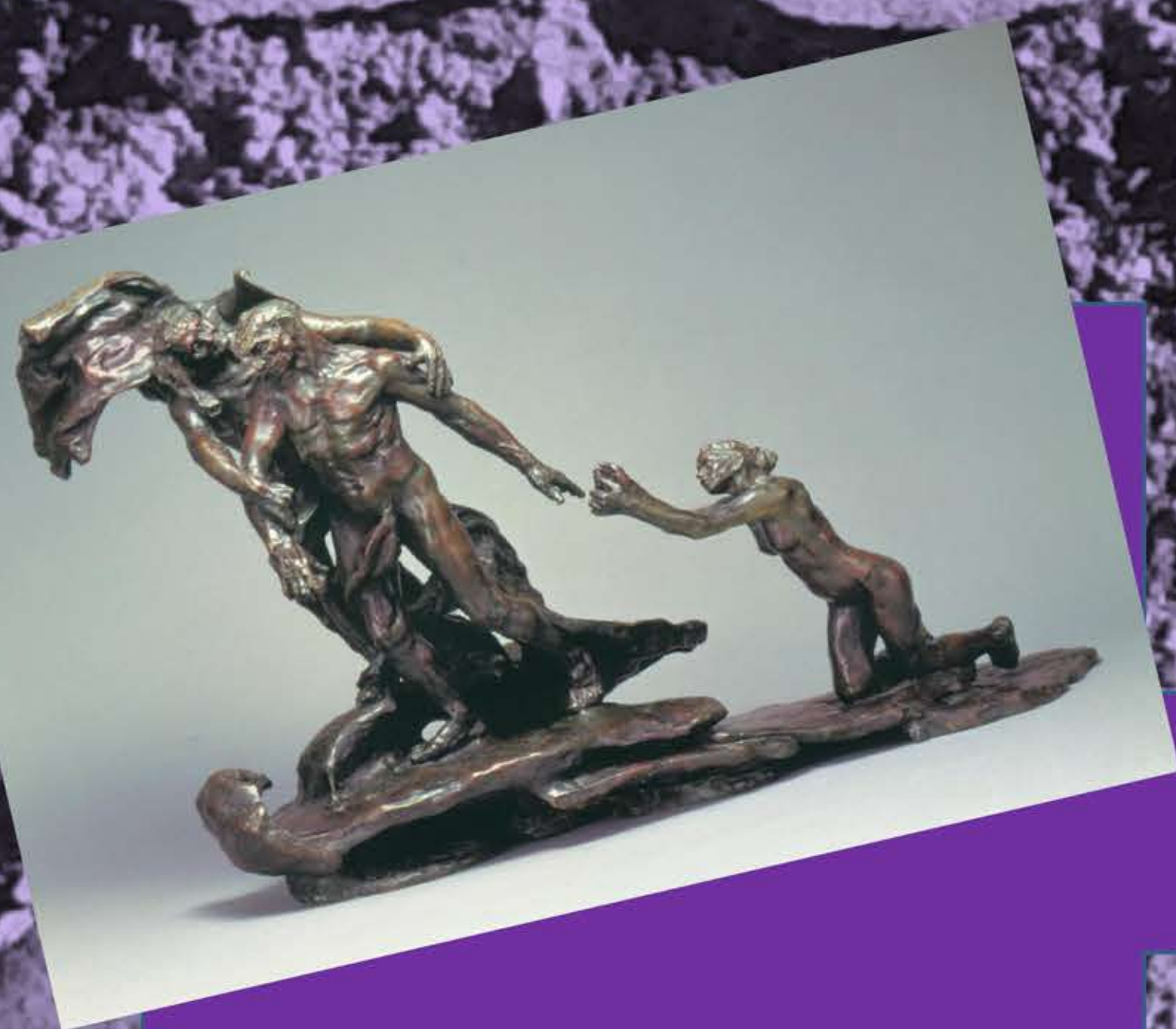
Primera mitad del siglo XX CAMILLE CLAUDEL, apoyada por su marido, Rodin, sin embargo su carácter innovador no ha sido prácticamente reconocido por la historiografía.