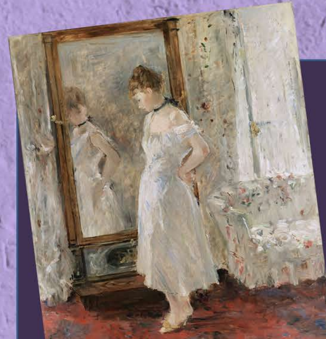
Segunda mitad del siglo XIX BERTHE MORISOT, una de las pocas mujeres que consiguió unirse a un grupo de artistas "cerrado" y que además fuera respetada y admirada por su trabajo