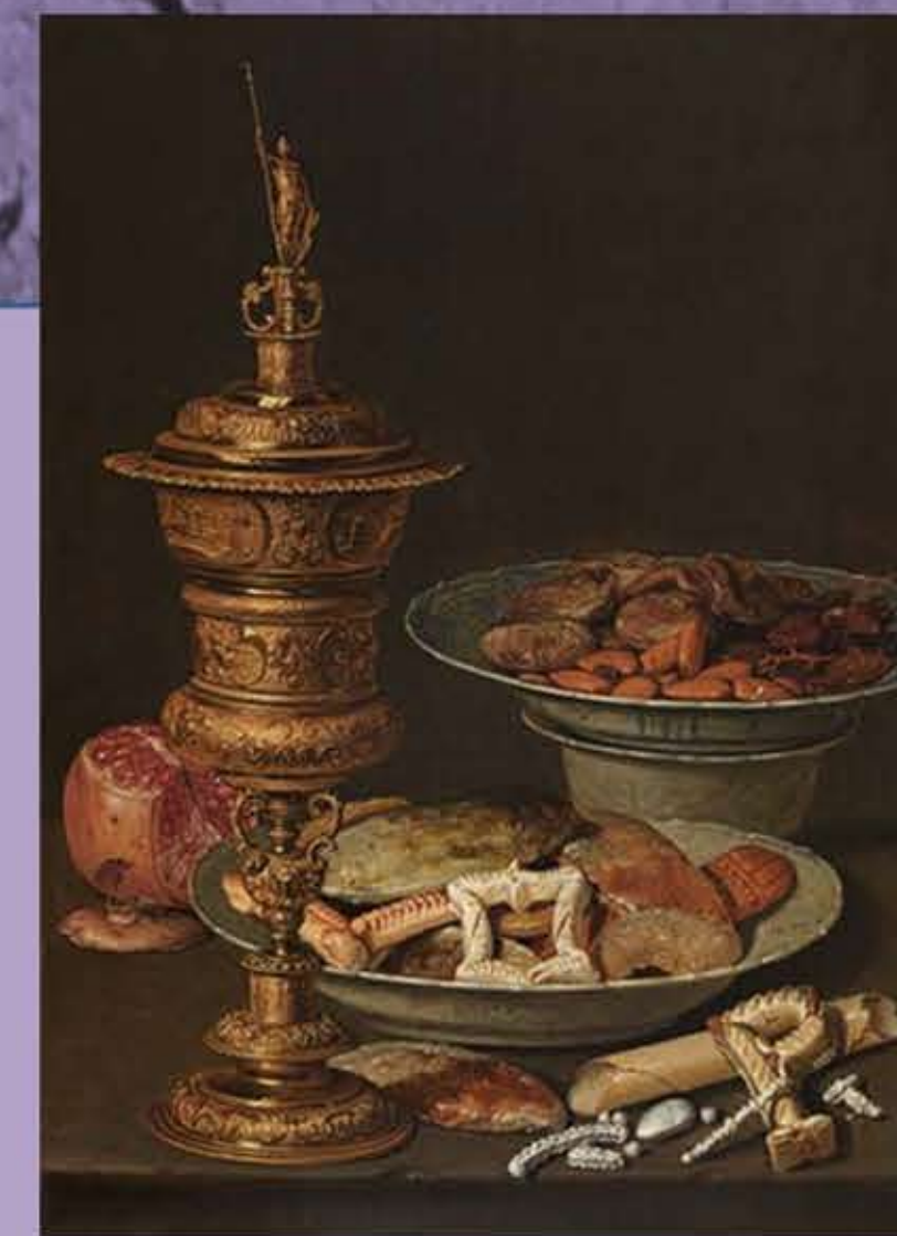
Primera mitad del siglo XVII. CLARA PEETERS, una de las pocas mujeres en dedicarse profesionalmente a la pintura, iniciando el bodegón y siendo la primera en ser expuesta en el Museo del Prado