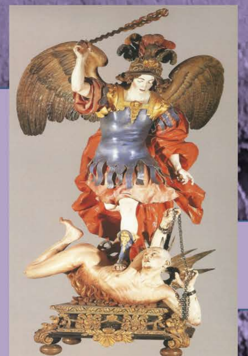
Segunda mitad del siglo XVII. LUISA ROLDÁN, llegó a ser "escultora de cámara" de Carlos II y Felipe V.