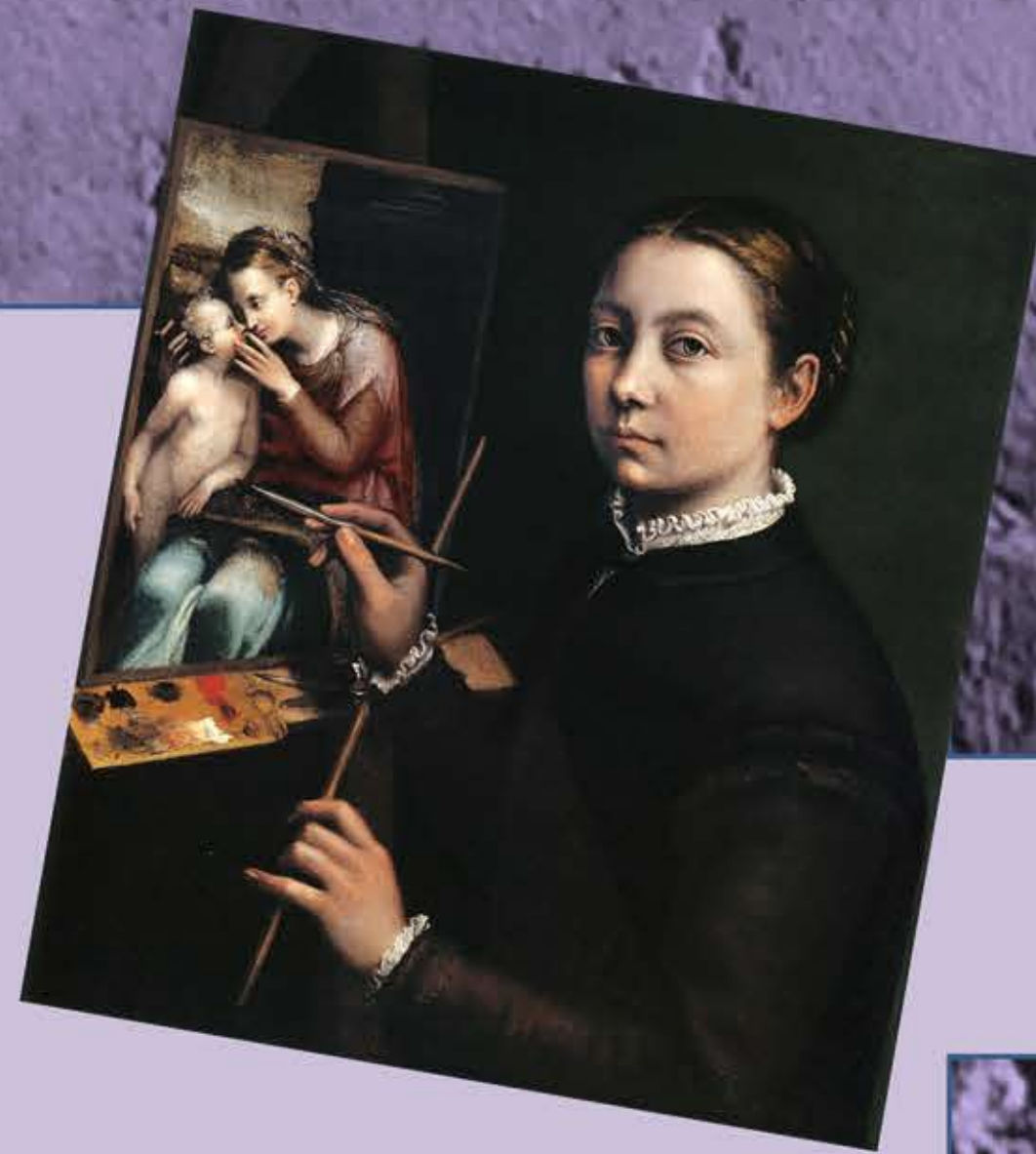
Primera mitad del siglo XVI. SOFONISBA ANGISSOLA, reconocida en su época, incluso por Miguel Ángel, la historiografía negó su papel de pintora hasta hace poco tiempo.