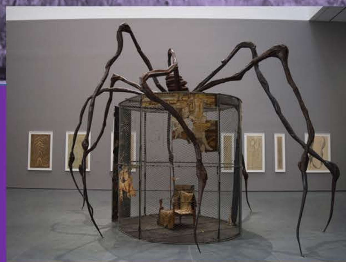
Siglo XX: LOUISE BOURGEOIS, primera mujer en tener una retrospectiva en el MOMA de Nueva York. Artista feminista, ya que la mirada y la percepción de su obra es la de la trayectoria vital de una mujer.