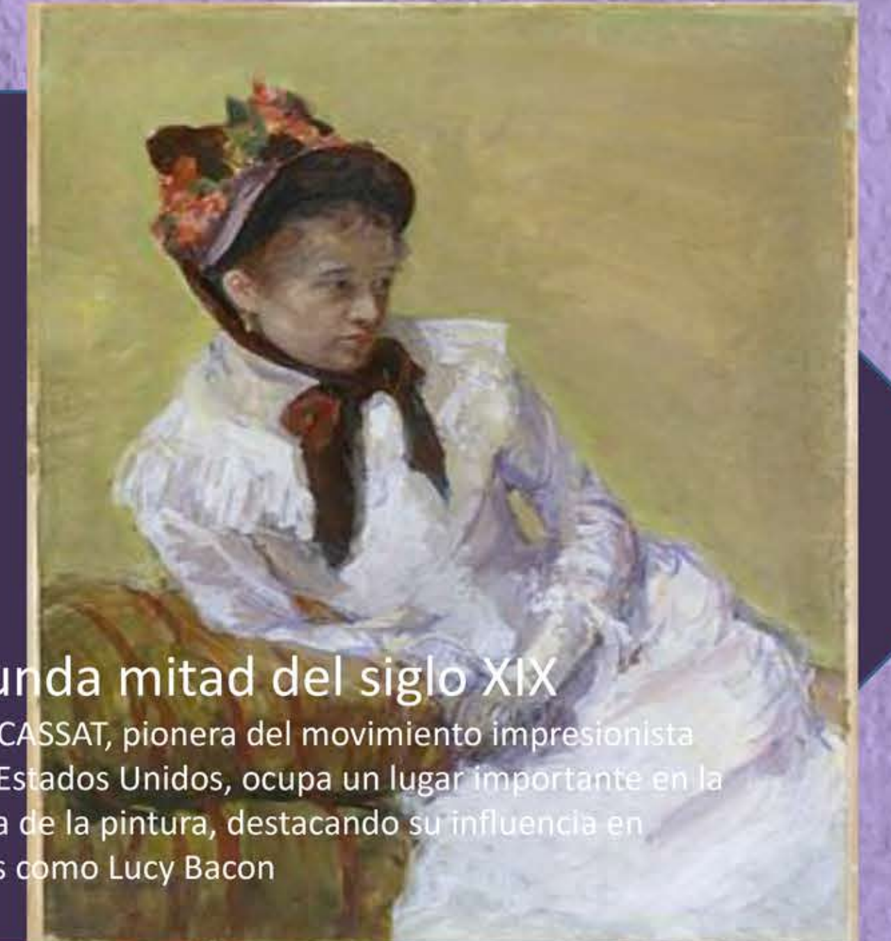
Segunda mitad del siglo XIX MARY CASSAT, pionera del movimiento impresionista en los Estados Unidos, ocupa un lugar importante en la historia de la pintura, destacando su influencia en artistas como Lucy Bacon