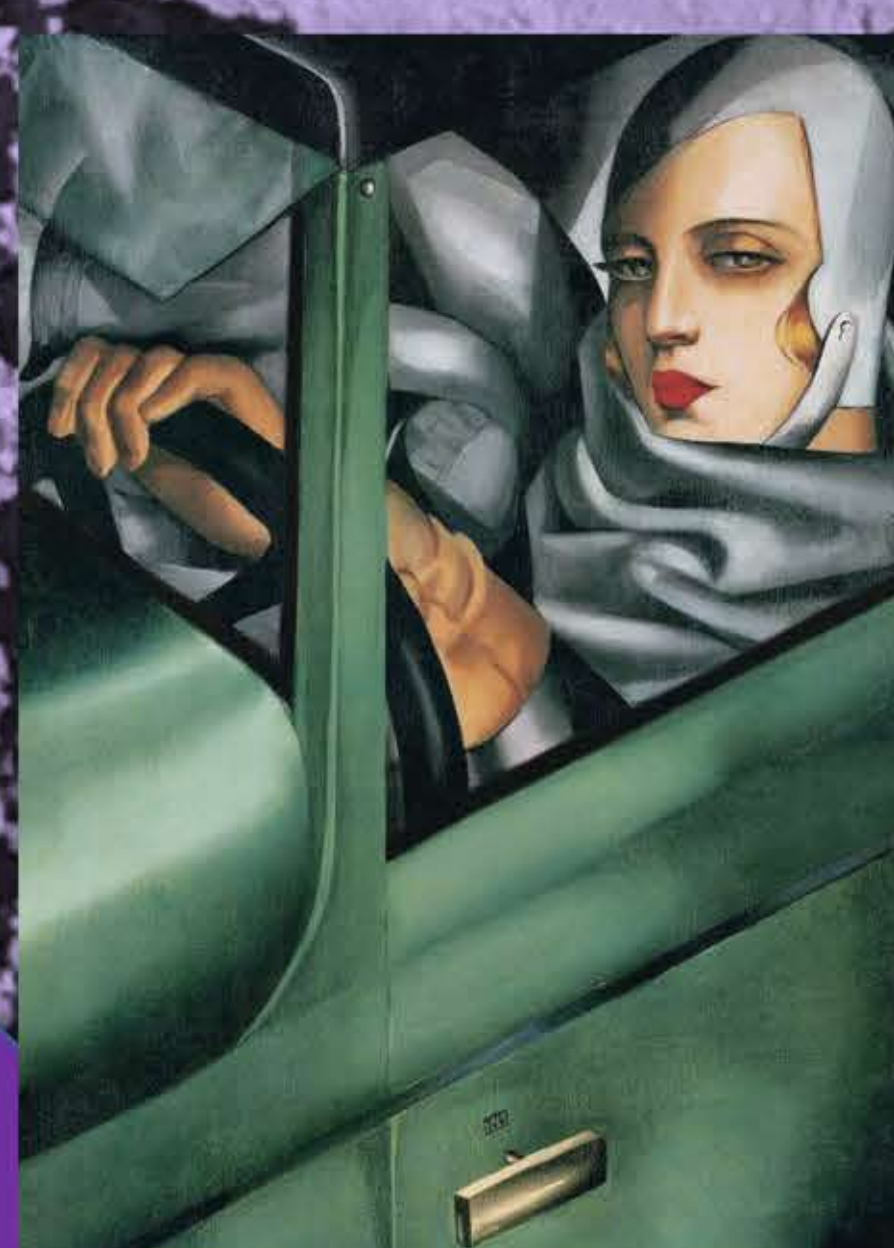
Primera mitad del siglo XX. TAMARA DE LEMPICKA, icono de mujer empoderada e independiente del siglo XX ( flappers ), y en la artista más popular del art déco, cuyos retratos se solicitan en toda Europa y América.