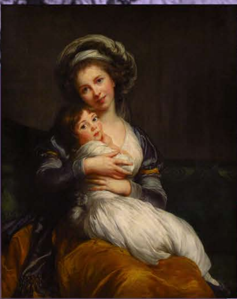
Segunda mitad del siglo XVIII. VIGÉE LEBRUN, llegó a pintar a ilustres personajes y ser reconocida en varias academias de arte de toda Europa.