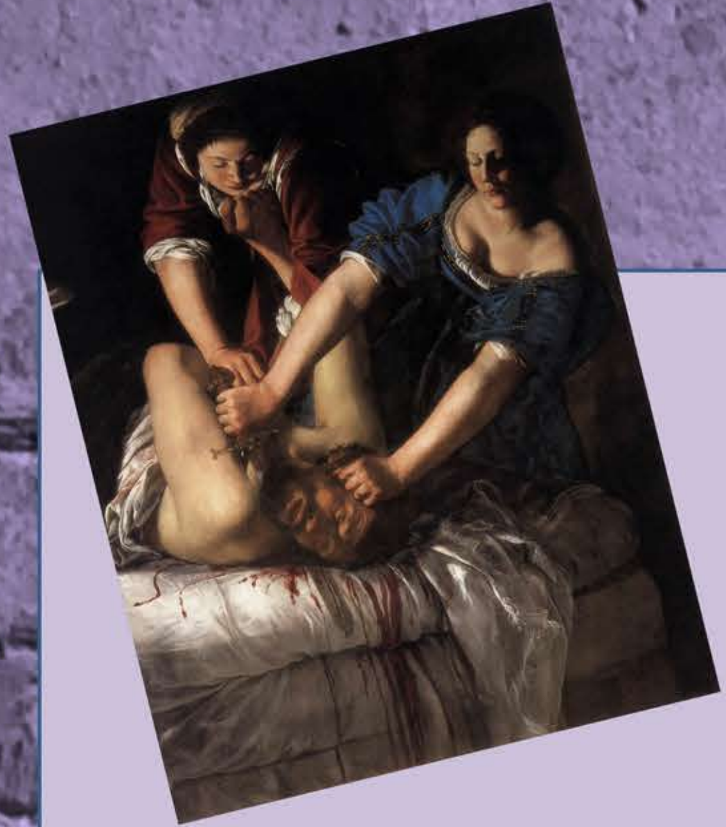
Primera mitad del siglo XVI. ARTEMISIA GENTILESCHI, primera mujer admitida en la academia de artes y diseño de Florencia