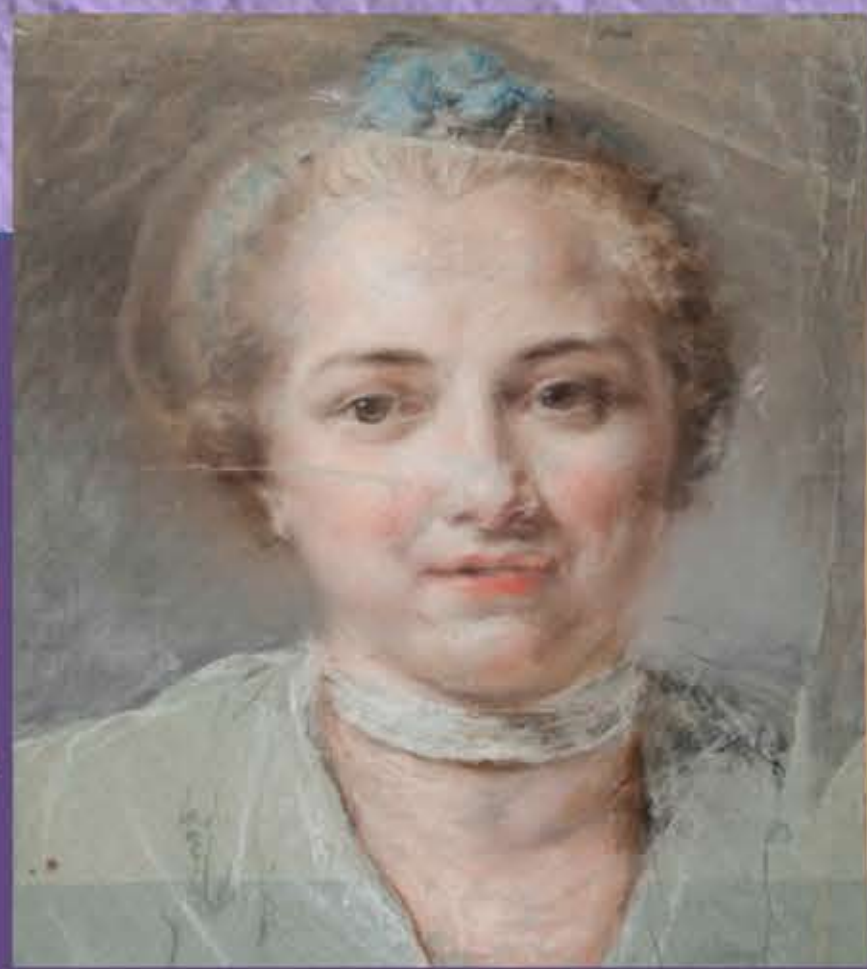
Segunda mitad del siglo XVIII. ANNA MARÍA MENGS, consiguió ser miembro de honor en la Real Academia de Bellas Artes de San Fernando de Madrid, donde será recordada y admirada