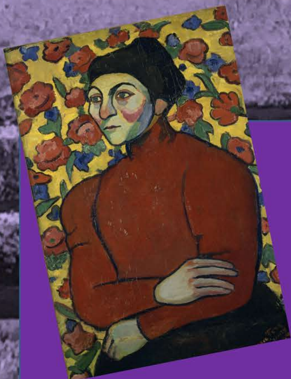
Siglo XX. SONIA DELAUNAY, primera mujer viva honrada con una exposición en el Louvre y nombrada oficial de la Legión de Honor por el estado francés