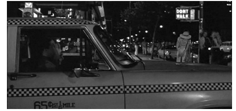
1 La noche de Nueva York desde el taxi de Travis.

Martin Scorsese cuenta en Taxi Driver la historia de un inadaptado excombatiente de la guerra de Vietnam llamado Travis Bickle (Robert de Niro), que reside en el Nueva York de 1975. Todo comienza cuando Travis, que sufre un estado de ansiedad e insomnio, decide trabajar como taxista en el turno de noche para matar el tiempo y ganar algo de dinero.